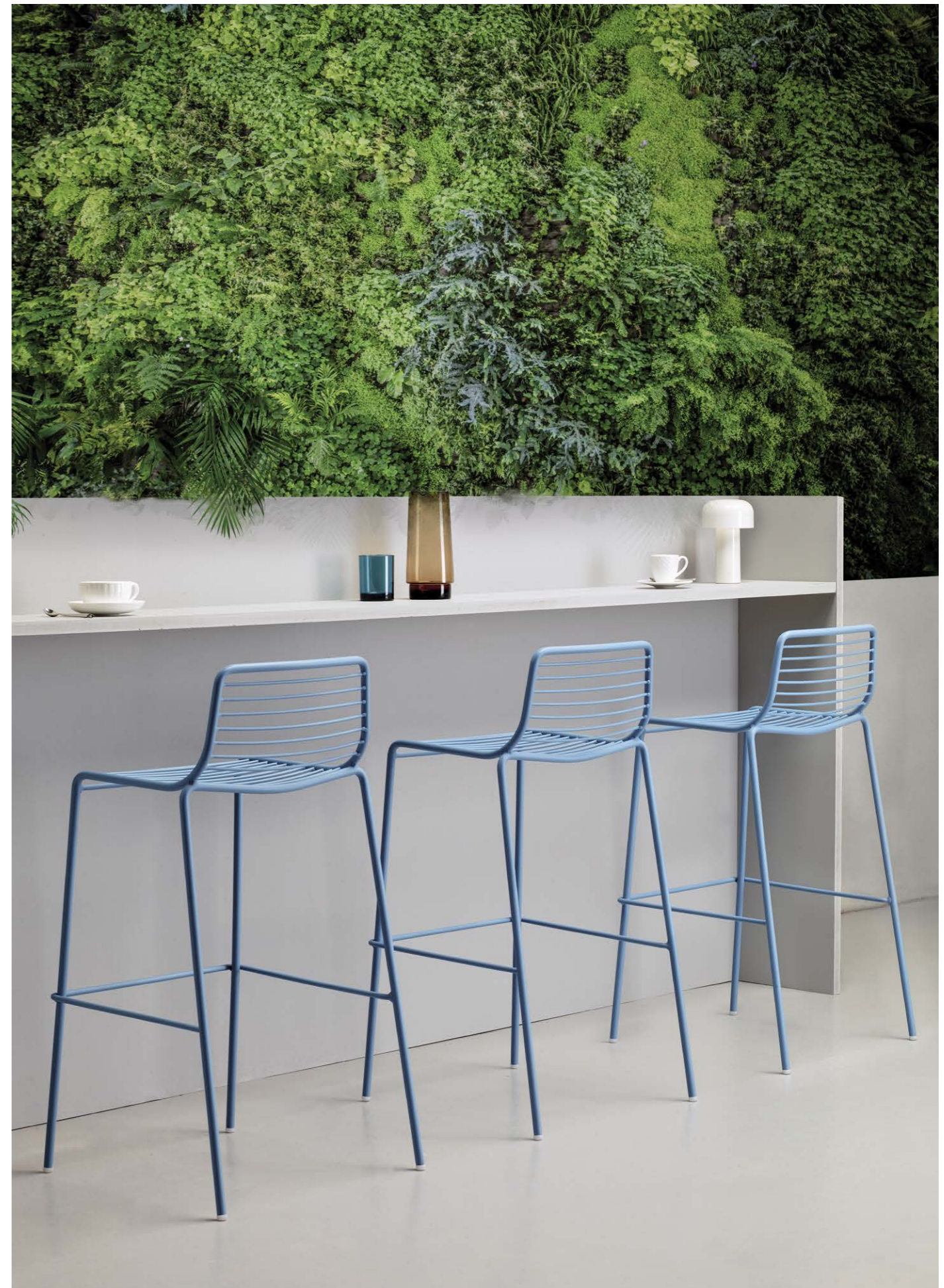
Stackable barstool Sgabello impilabile Summer, art. 2535 h.75

Struttura in acciaio zincato e verniciato a polvere.