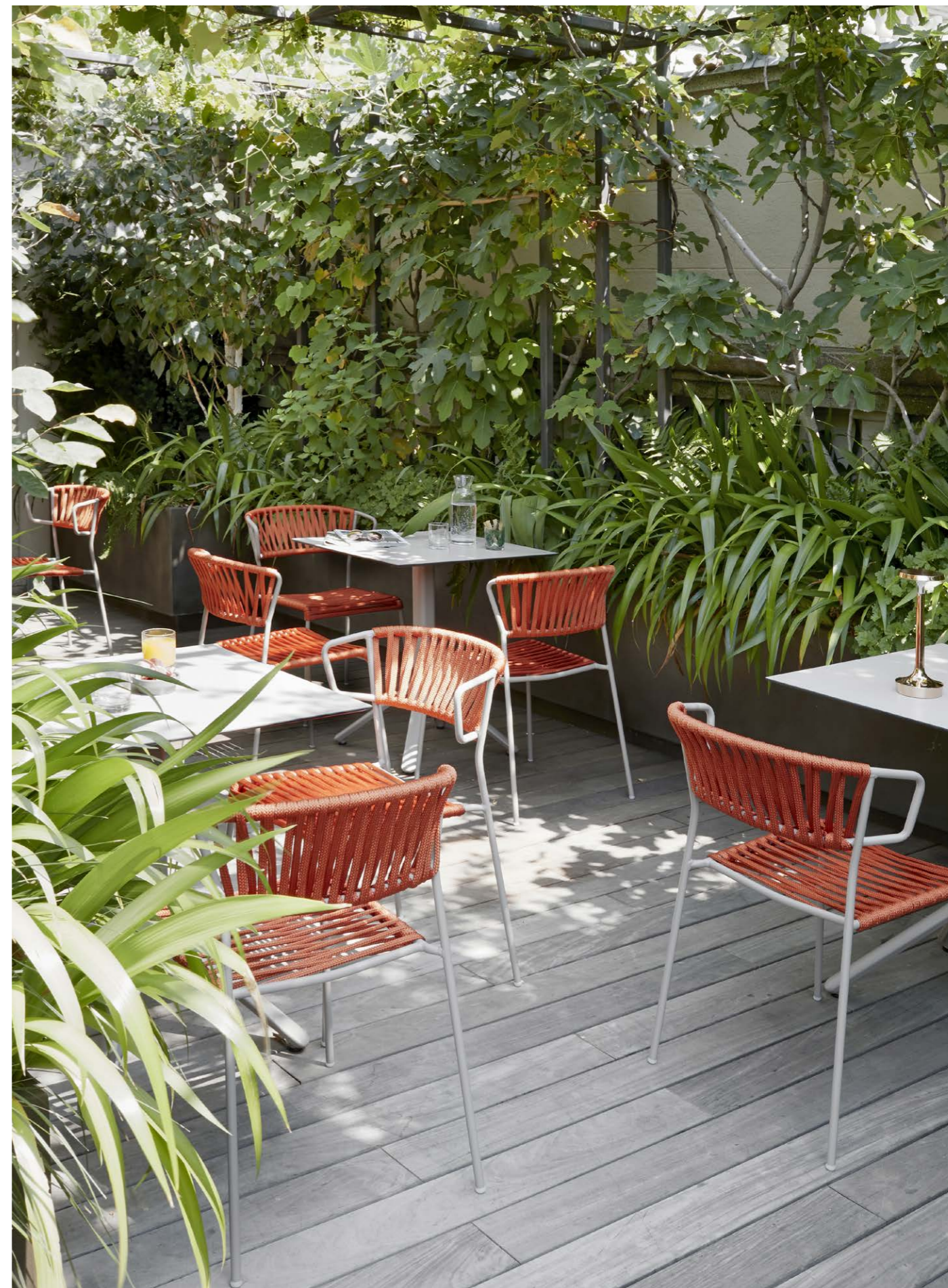
Chair Sedia Lisa Filò, art. 2870 Armchair Poltrona Lisa Filò, art. 2869

Telaio in acciaio zincato e verniciato a polvere, intreccio in corda nautica.