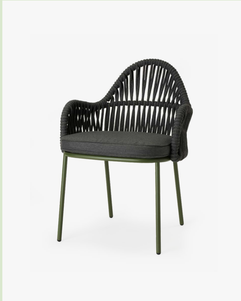
Armchair Poltrona Malvasia Riviera, art. 2908

(En) Malvasia Riviera is an outdoor accent chair designed to embody a sense of conviviality and relaxation. It stands out with a frame featuring a woven rope backrest, offering a warmer and more natural touch. The generous proportions of the armrests and the padded seat ensure immediate comfort. (It) Malvasia Riviera è una poltroncina da esterni pensata per incarnare un ideale di convivialità e relax. Si distingue per il telaio con schienale in corda intrecciata, che conferisce un tocco più caldo e naturale. Le proporzioni generose dei braccioli e la presenza di una seduta imbottita assicurano un comfort immediato.