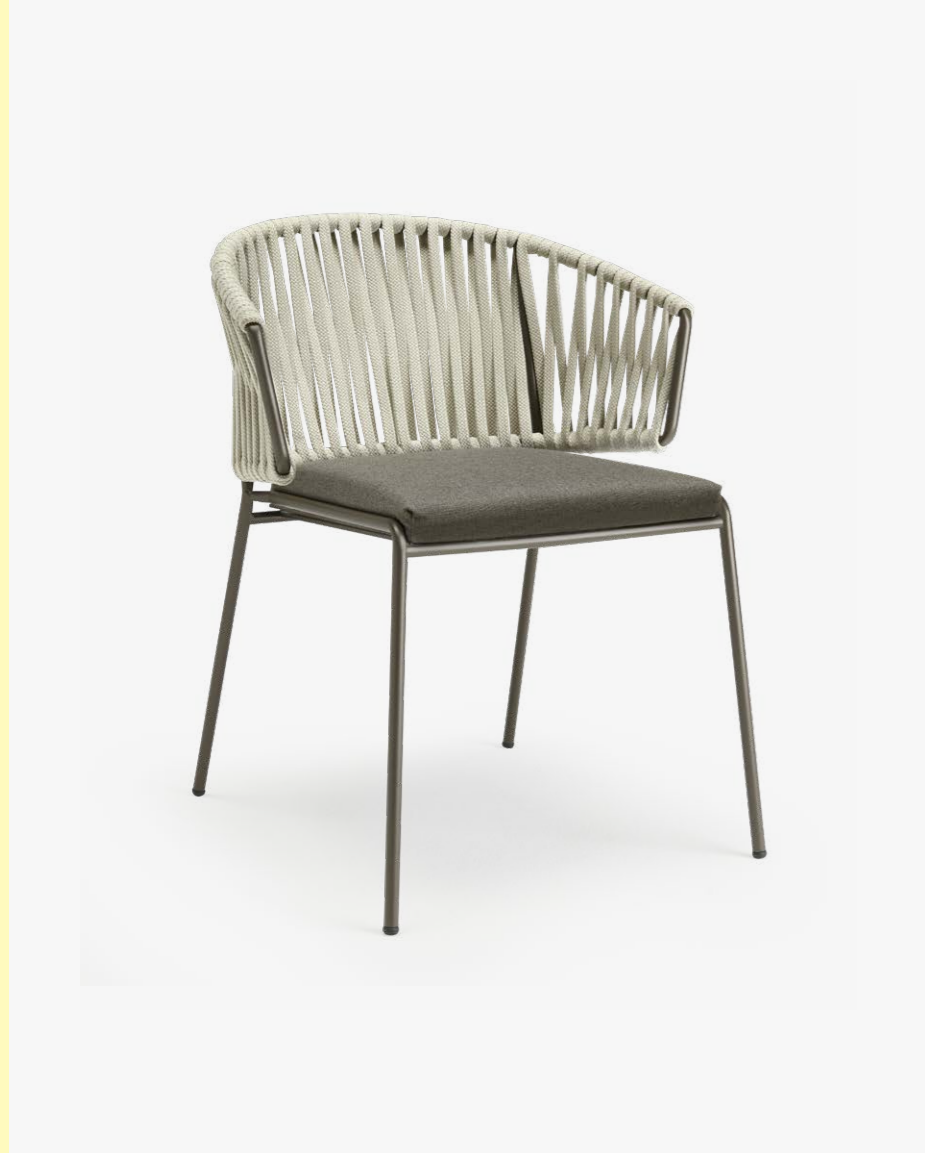
Armchair Poltrona Lisa Filò Nest, art. 2899

(En) Lisa Filò Nest is a cosy accent chair with a generously shaped backrest, ideal for use as a seat around the table or in a quiet nook. The heartwarming sensation of a nest, in which you can feel protected, is enhanced by the backrest cushion, as an optional accessory. (It) Lisa Filò Nest è una poltroncina avvolgente con uno schienale dalle forme generose che ben si presta come seduta intorno a un tavolo o a un angolo relax. La sensazione accogliente di un nido in cui sentirsi protetti è accentuata dal cuscino schienale, accessorio opzionale.