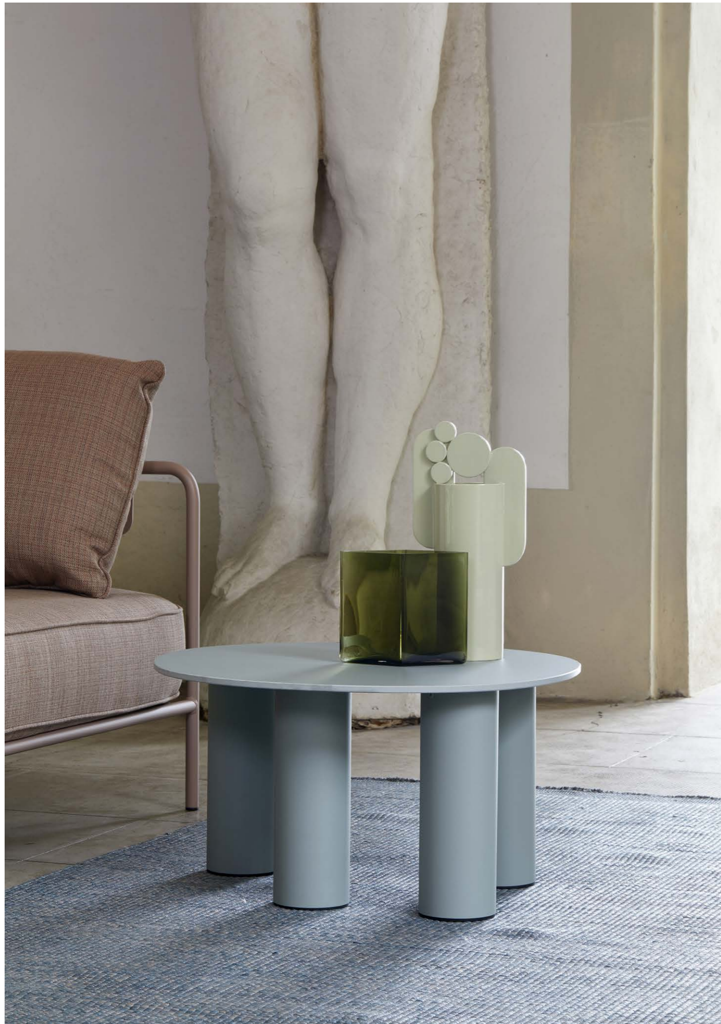
Coffee Table Hyppo, art. 2757