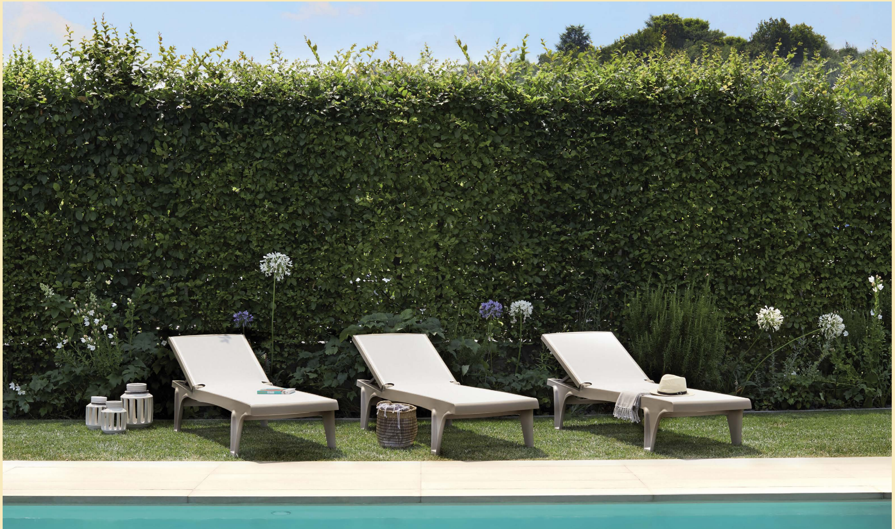
Tahiti, art. 2043

Stackable sun-bed with wheels Lettino impilabile con ruote