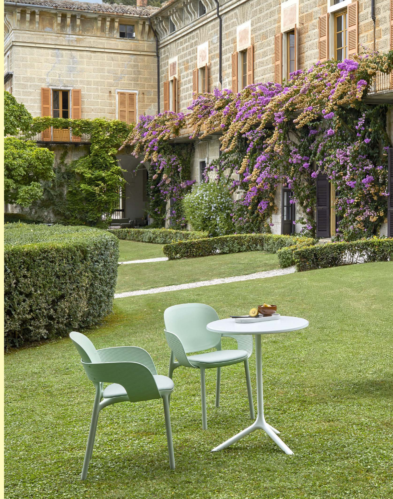
Armchair Poltrona Hug, art. 2382 Base Tripé, art. 5000 h. 73