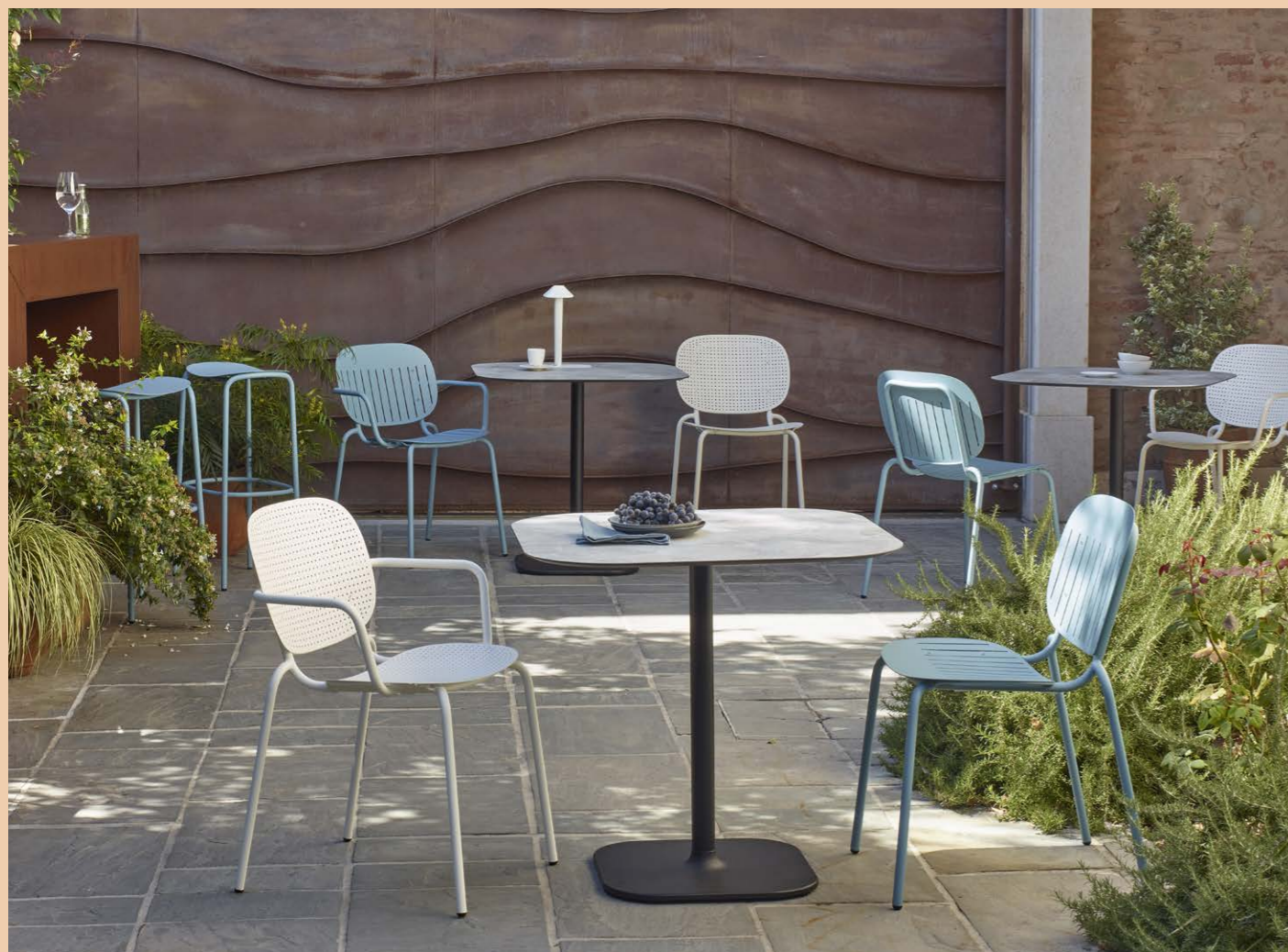
Chair Sedia Si-Si Dots, art. 2505 Armchair Poltrona Si-Si Dots, art. 2504 Chair Sedia Si-Si Barcode, art. 2508 Armchair Poltrona Si-Si Barcode, art. 2507 Base Rhino h.73, art. 5184

NEO HOTEL, Kapsimalis Architects, Oia, Santorini, Greece