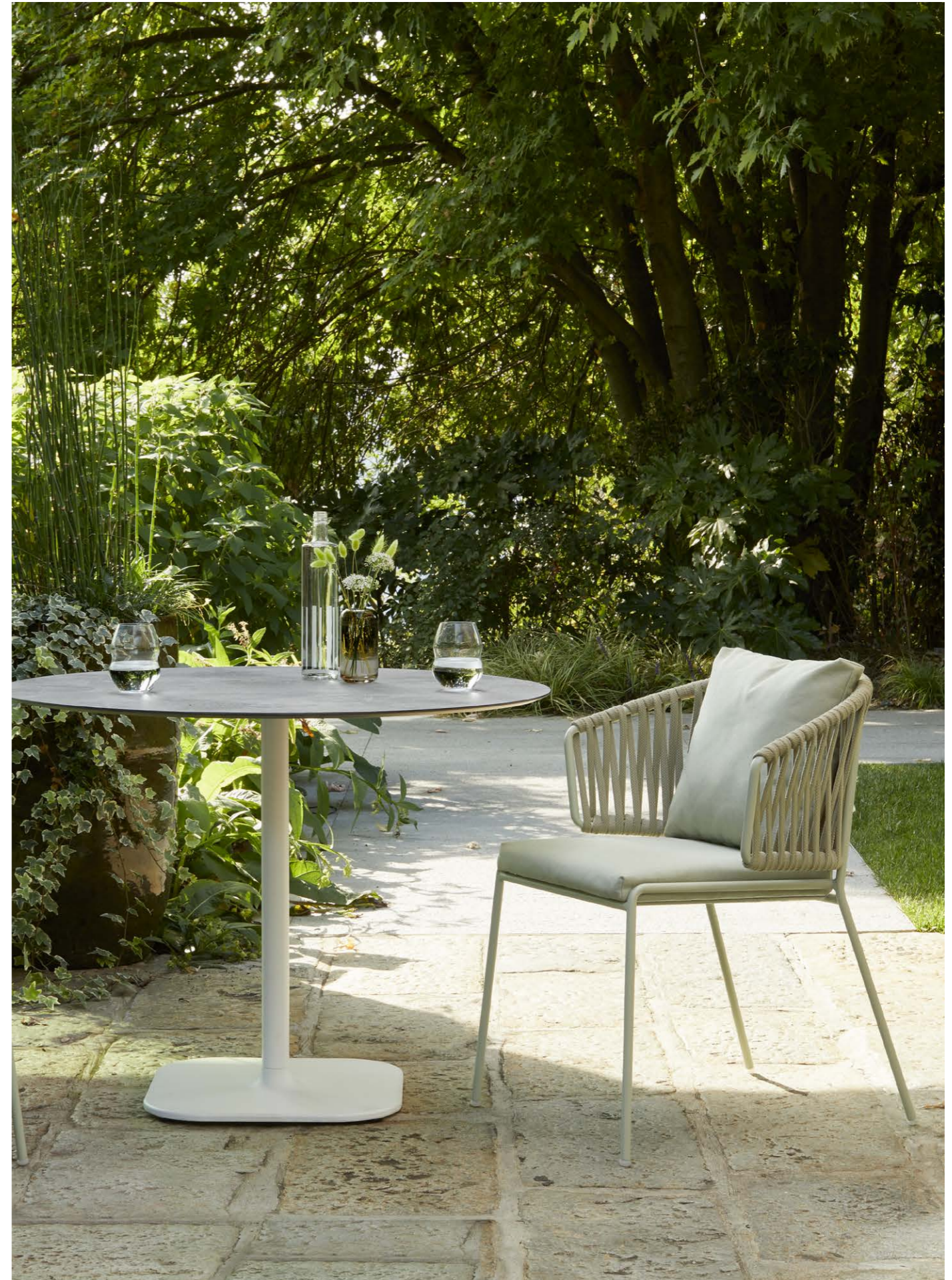
Base Rhino, art. 5184, h. 73

Telaio in acciaio verniciato a polvere, intreccio in corda nautica. Cuscini tessuto acrilico.