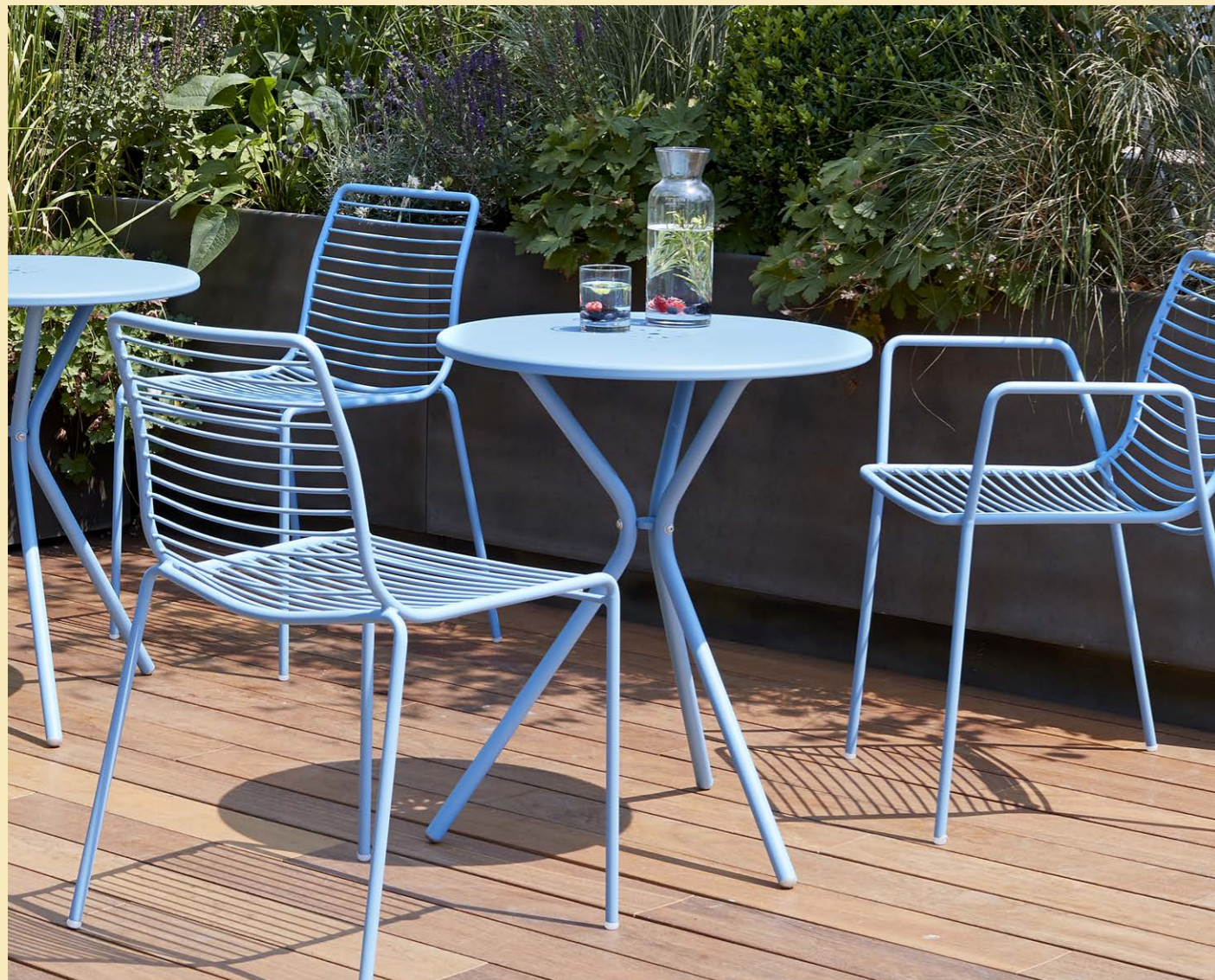
Table Tavolo Leo, art. 2719 Ø 60 h.73 Stackable chair Sedia impilabile Summer, art. 2522 Stackable armchair Poltrona impilabile Summer, art. 2520