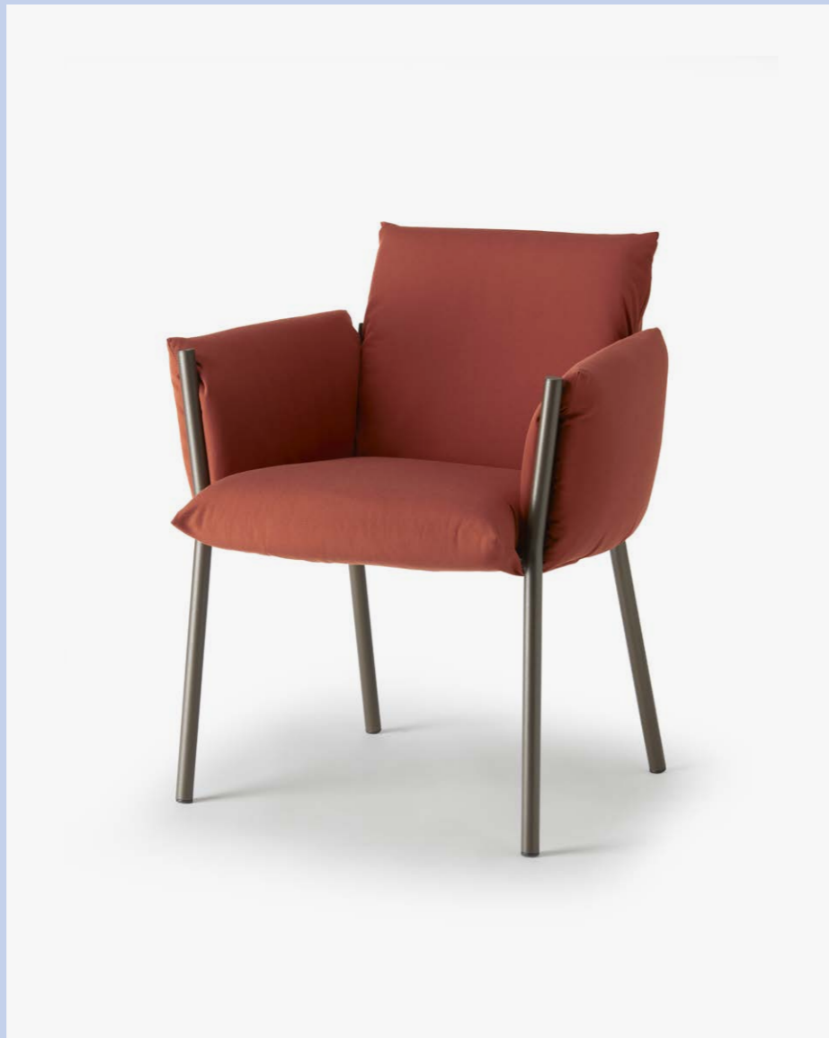
Armchair Poltrona Brezza, art. 2898

(En) In Brezza, the frame and cushions connect in a new way, combining solidity, resistance, and an innate elegance in a project born with outdoor comfort in mind. The generous padding leaves the round-section metal legs visible, which give strength and recognisability to the armchair. (It) Brezza, progetto nato pensando al comfort in outdoor in cui telaio e cuscineria dialogano in modo inedito, comunica solidità e resistenza e una innata eleganza informale. La generosa imbottitura lascia a vista le gambe in metallo a sezione tonda che donano forza e riconoscibilità alla poltroncina.