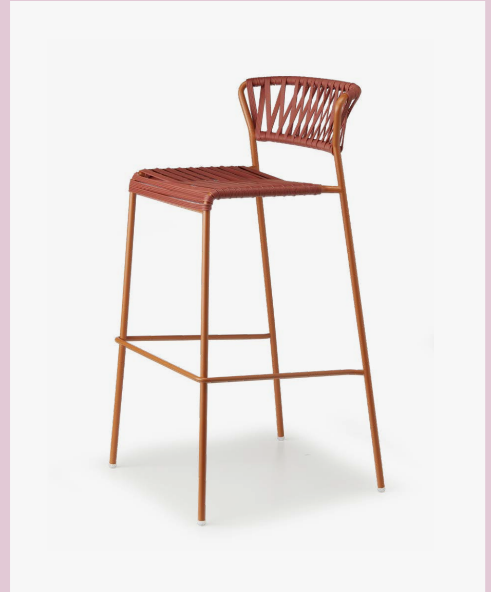
Barstool Sgabello Lisa Club, art. 2875 h.75