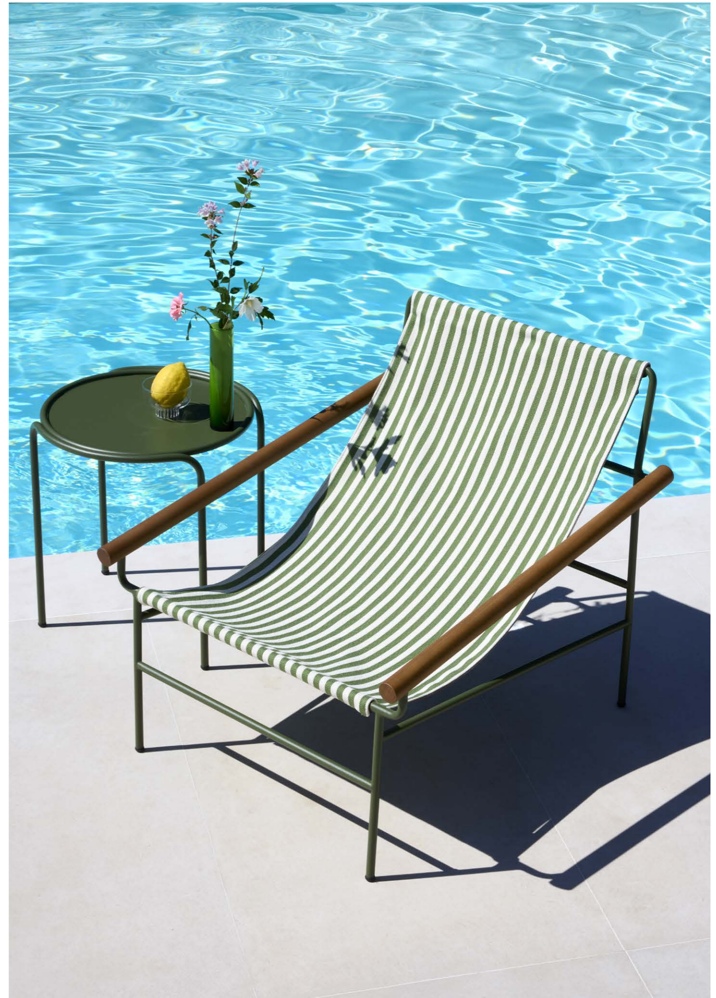
Round Coffee table rotondo Dress_Code, art. 2742 Ø 45 h.50