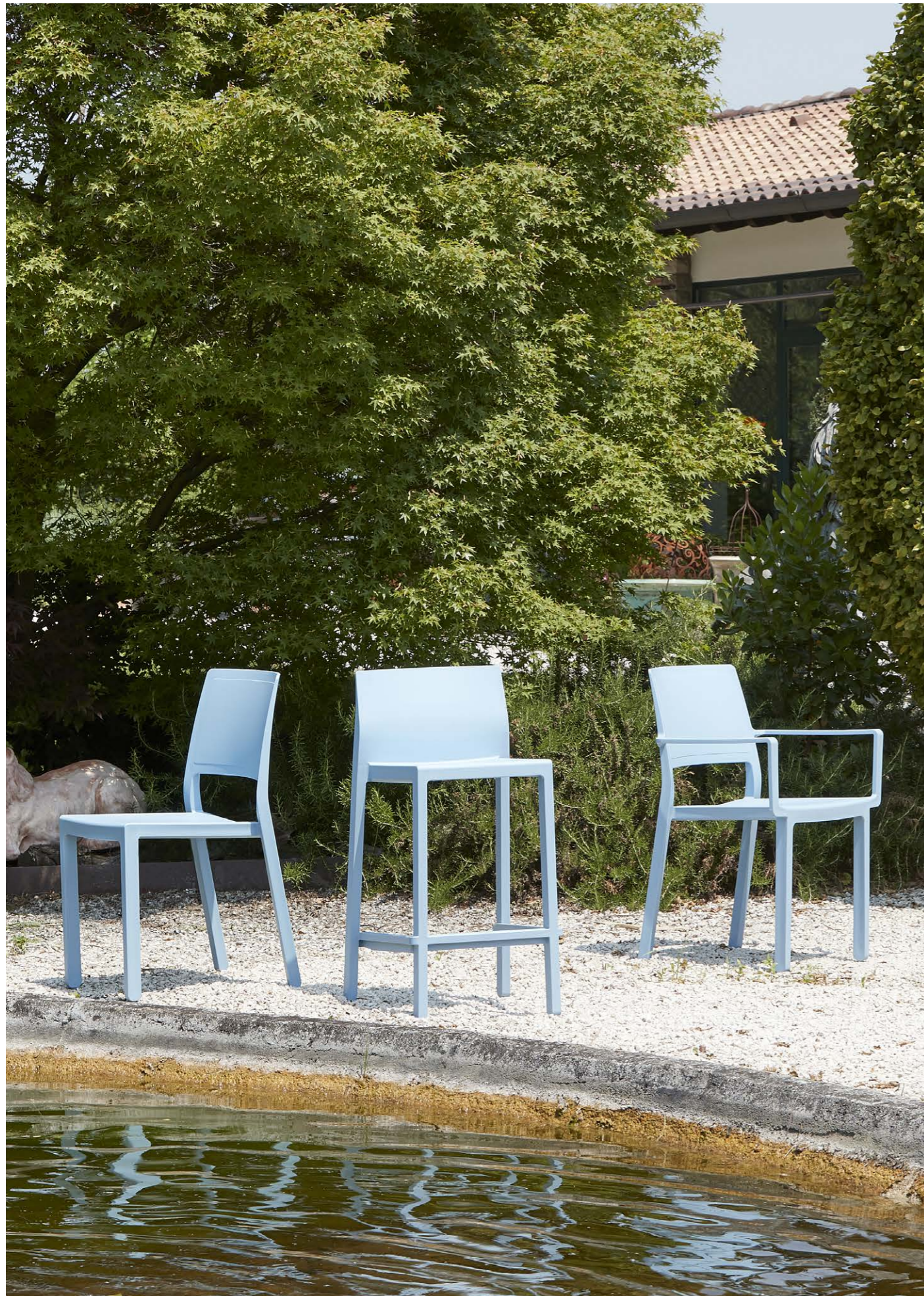
Stackable barstool Sgabello impilabile Kate, art. 2346 h.65 Stackable armchair Poltrona impilabile Kate, art. 2340