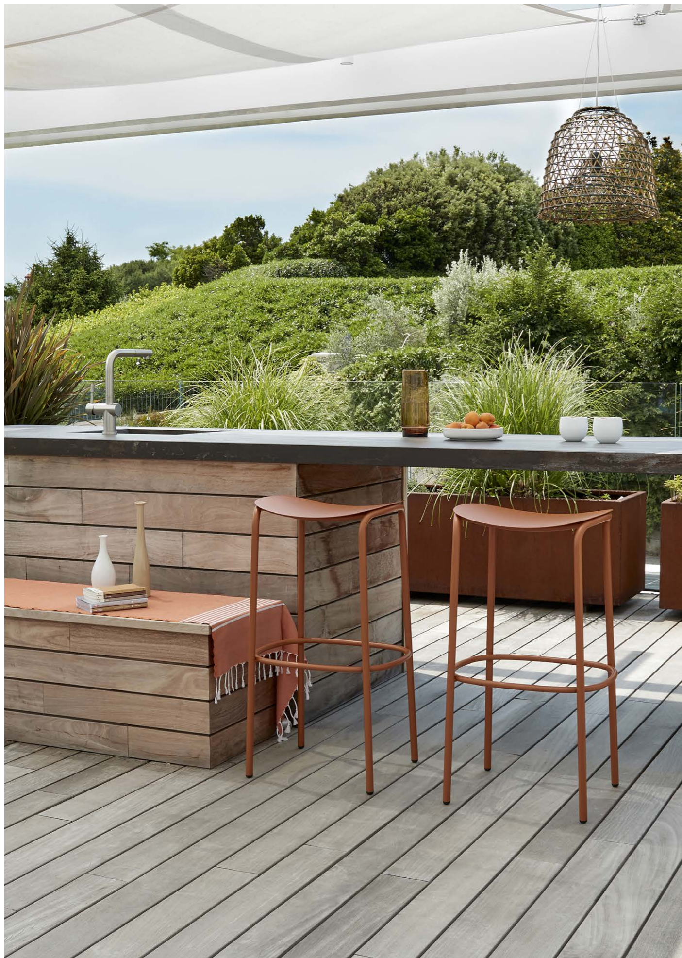
Barstool Sgabello Trick, art. 2523 h.75

Zinc and powder coated steel frame. Struttura in acciaio zincato e verniciato a polvere.