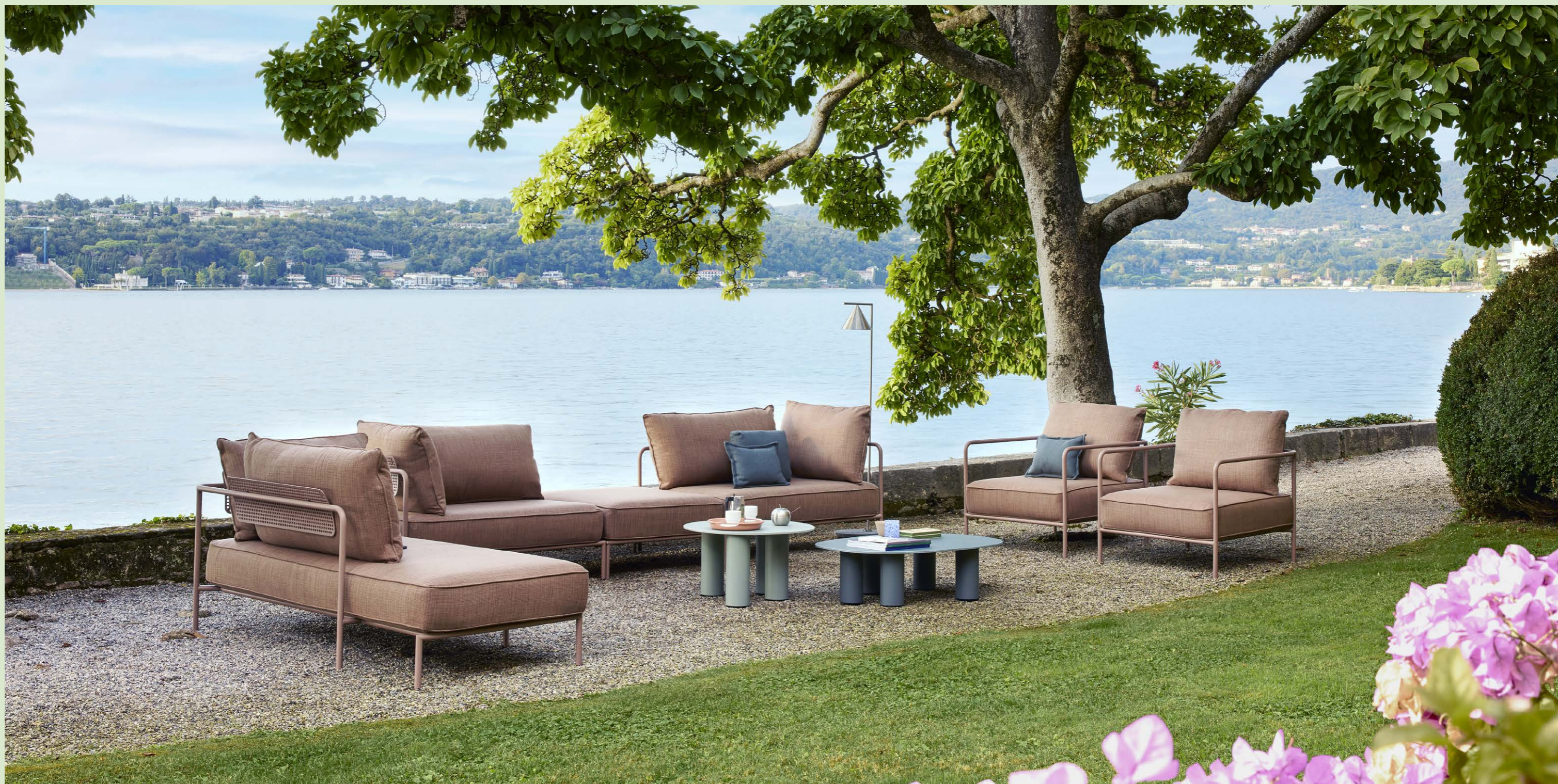
Modular system Sistema modulare Flap, art. 2903 - 2887 - 2904 - 2889 - 2905 Coffee table Hyppo, art. 2757 - 2758

(En) Flap is a series of modular upholstered furniture where seating elements are combined in compositions with support surfaces. A Flap, which sits on the tubular structure and can rotate roughly 15 degrees on its axis, allowing the support cushion to have varying inclinations for maximum comfort, is what defines the system and gives the collection its name. "A seat that could be used in a variety of scenarios, both residential and commercial." (It) Flap è una collezione di imbottiti modulari in cui gli elementi di seduta si combinano in composizione ai piani d'appoggio. Dettaglio che contraddistingue il sistema e da cui prende il nome la collezione è lo schienale mobile, un alettone, un Flap, che si adagia sul tubolare della struttura e che può ruotare sull'asse di circa 15 gradi, consentendo al cuscino differenti inclinazioni per raggiungere il miglior comfort possibile. "Una seduta adatta a diversi contesti d'uso sia nel residenziale che nel contract."