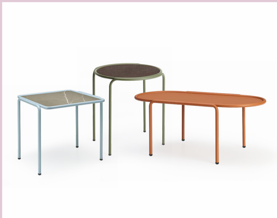
Round Coffee table rotondo Dress_Code, art. 2742 Ø 45 h.50 Oval Coffee table ovale Dress_Code, art. 2744 36x77 h.30 Square Coffee table quadrato Dress_Code, art. 2743 41x41 h.40

Three coffee tables, to be used individually or in combination. Metal frame. Metal, black cork or HPL top.