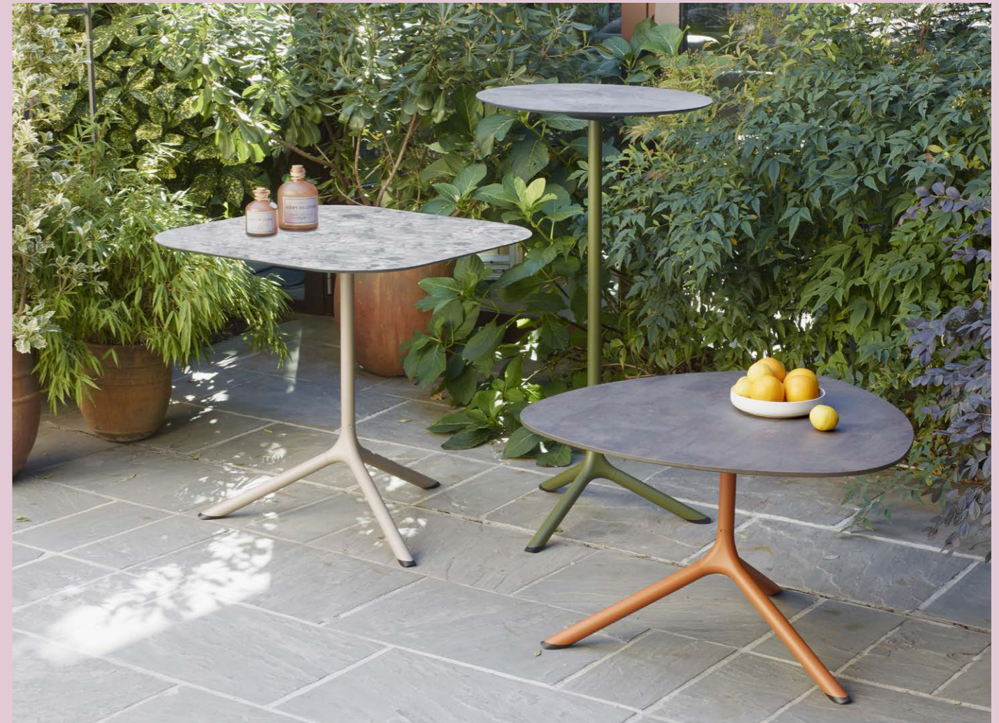
Folding base Tripé affiancabile, art. 5001 h.109 Base Tripé Maxi, art. 5006 h.73 Base Tripé Maxi, art. 5009 h.50