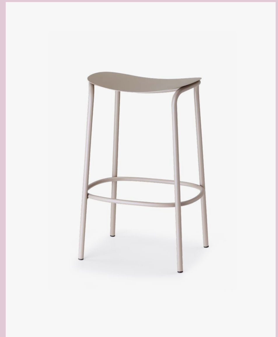
Barstool Sgabello Trick, art. 2524 h.65