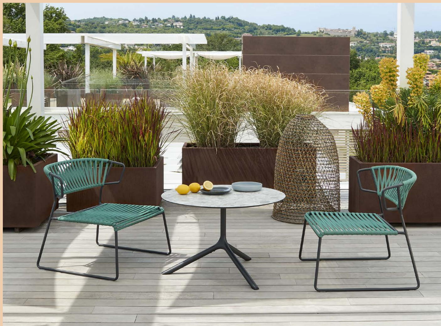
Lounge armchair Poltrona Lisa Lounge Filò, art. 2878

Zinc and powder coated steel frame, braided in nautical rope.