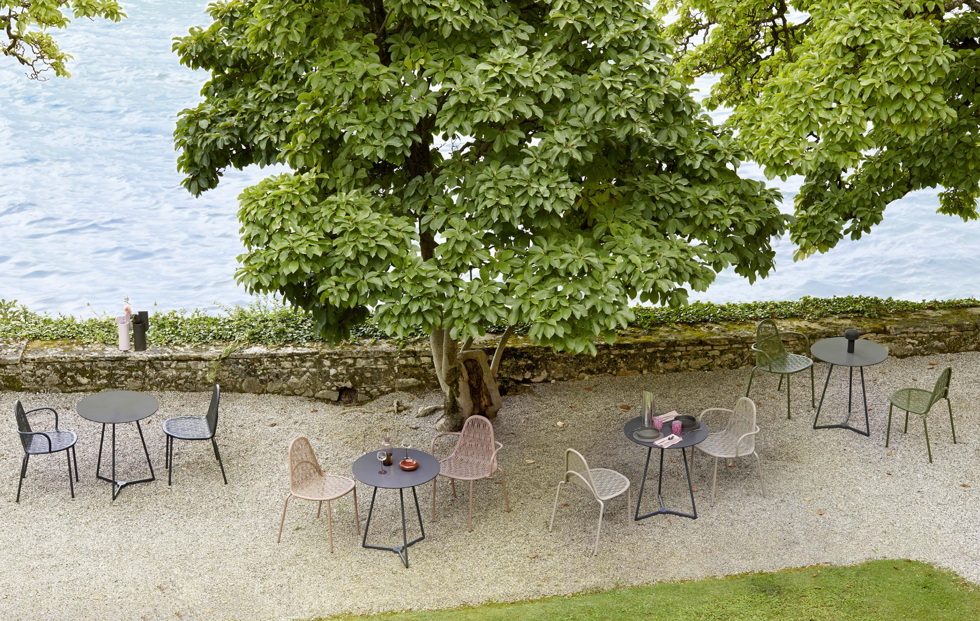
3 Legs Base Atomo, art. 5032 h.73 Chair Sedia Malvasia, art. 2906 Armchair Poltrona Malvasia, art. 2907