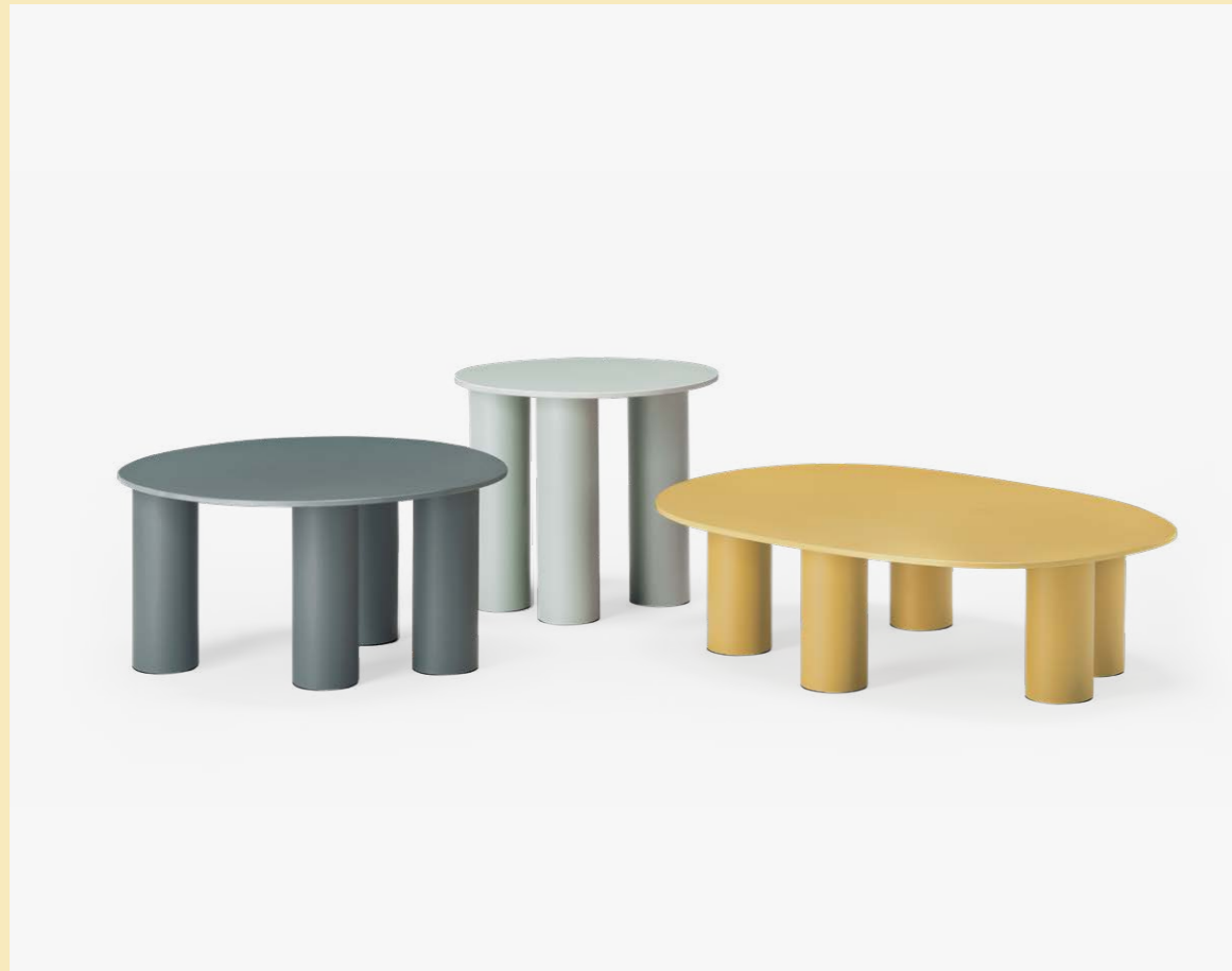
Coffee Table Hyppo, art. 2757, 2756, 2758

(En) The result of playful experimentation, the Hyppo coffee-table family is designed for outdoor use but adapts with versatility to indoor spaces. The inspiration, clear even from the name itself, is linked to the morphology of the hippopotamus and is revealed in the design of the aluminium legs, large and sculptural. (It) Esito di una sperimentazione ludica, la famiglia di coffee-table Hyppo è pensata per l'outdoor, ma si adatta con versatilità anche agli spazi indoor. L'ispirazione, rivendicata fin dal nome, si lega alla morfologia dell'ippopotamo e si rivela nel disegno delle gambe in alluminio, importanti e scultoree.