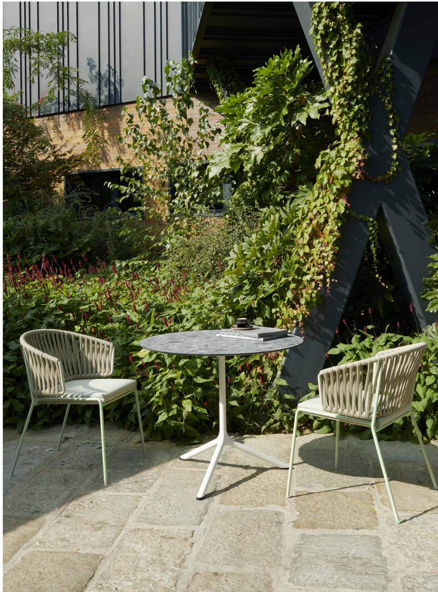
Armchair Poltrona Lisa Filò Nest, art. 2899 Base Tripé Maxi, art. 5006

Steel base with die-cast aluminium junction. Base in acciaio con snodo in alluminio pressofuso.