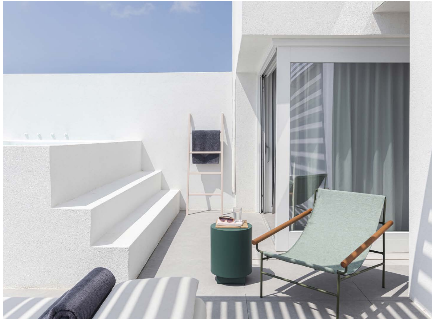
Lounge armchair Poltrona Dress_Code Smart, art. 2581

NEO HOTEL, Kapsimalis Architects, Oia, Santorini, Greece