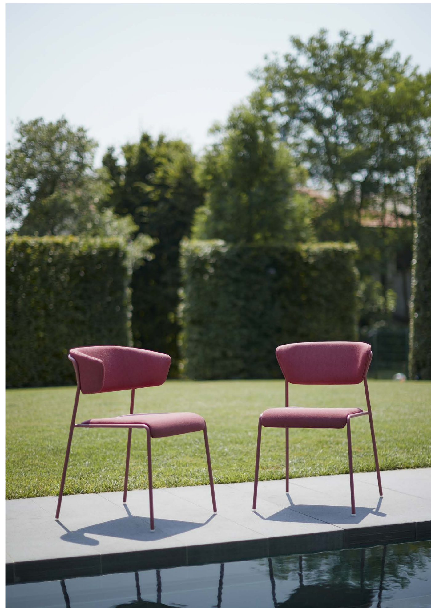
Armchair Poltrona Lisa Outdoor, art. 2860 Chair Sedia Lisa Outdoor, art. 2861