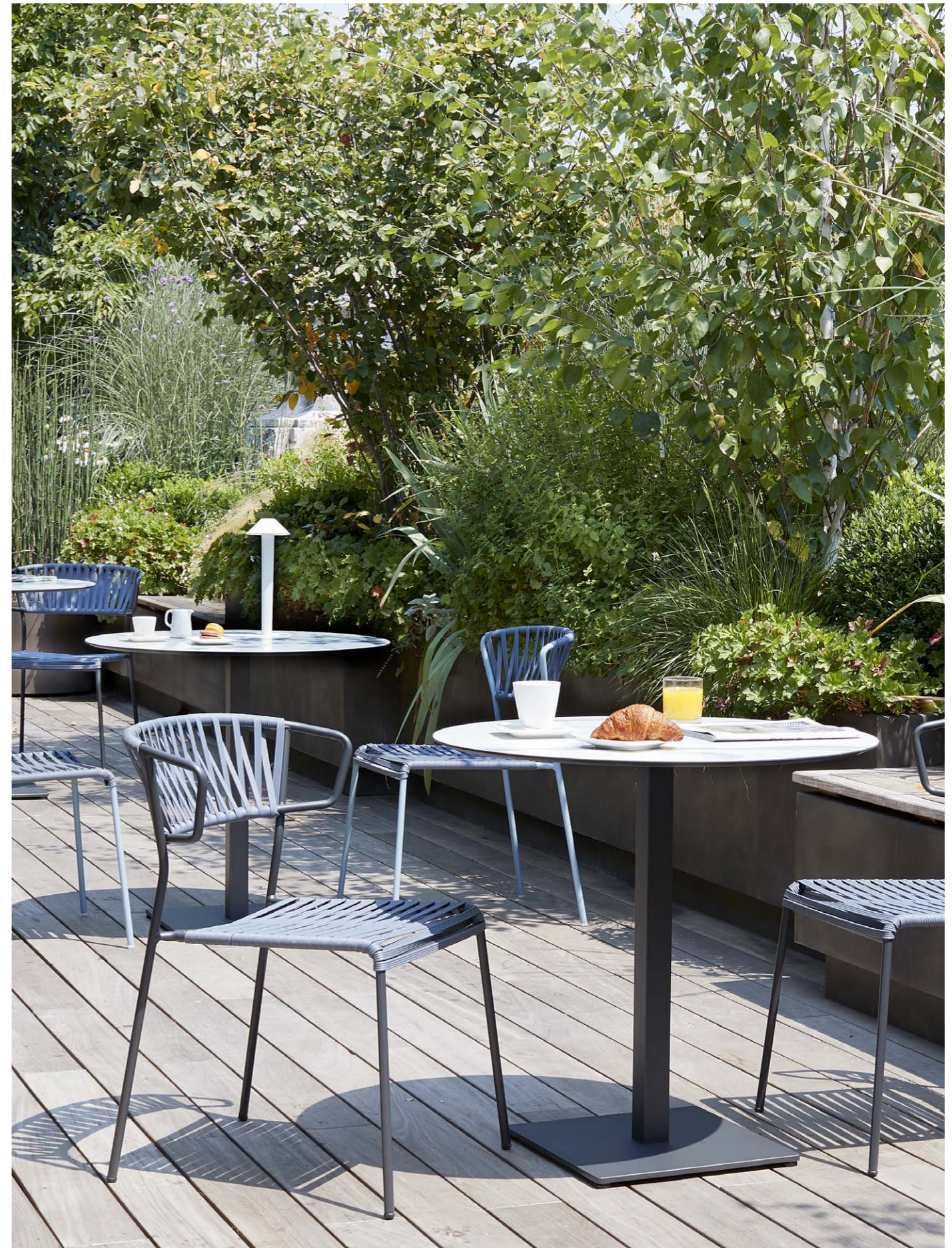
Armchair Poltrona Lisa Club, art. 2873 Chair Sedia Lisa Club, art. 2874 Base Tiffany, art. 5182

Telaio in acciaio zincato e verniciato a polvere, intreccio in estruso di PVC.