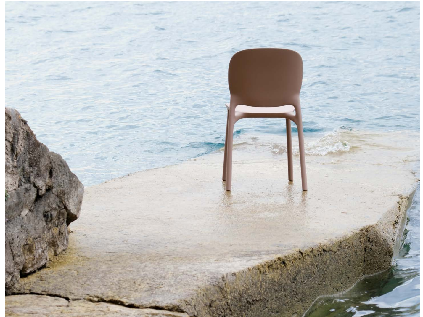
Chair Sedia Hug, art. 2380