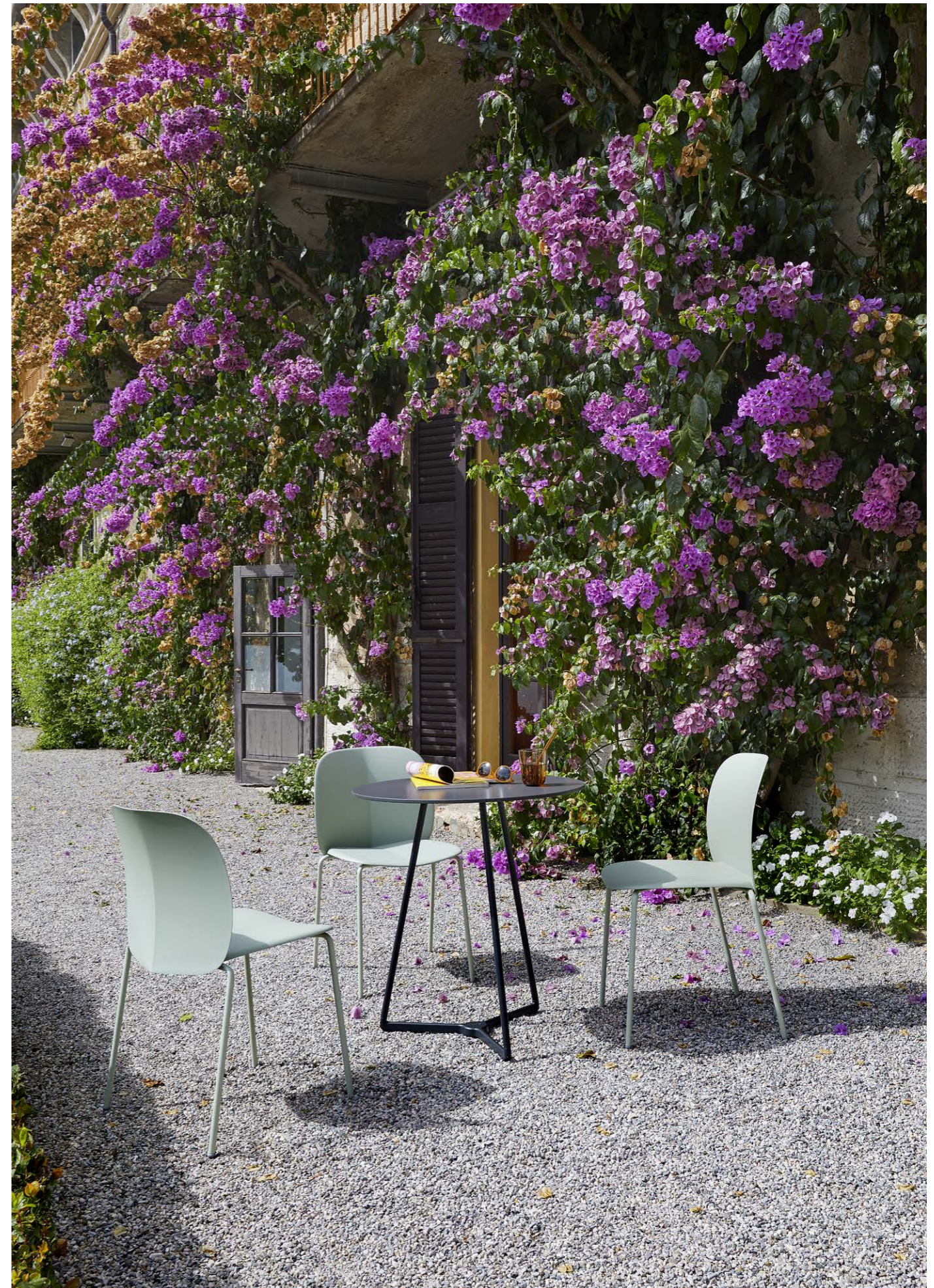
3 Legs Base Atomo, art. 5032 h.73 Chair Sedia Mentha, art. 2706

(En) Mentha is a cool, comfortable and cosy seat, made from certified recycled plastic. Mentha is a seating system, the shell can be paired with a variety of frames, making it a highly versatile collection. (It) Mentha è una seduta fresca, pratica, confortevole e accogliente in plastica certificata riciclata. Mentha rappresenta un sistema di sedute, la scocca viene montata su diverse tipologie di telaio: per questo è una collezione altamente versatile.