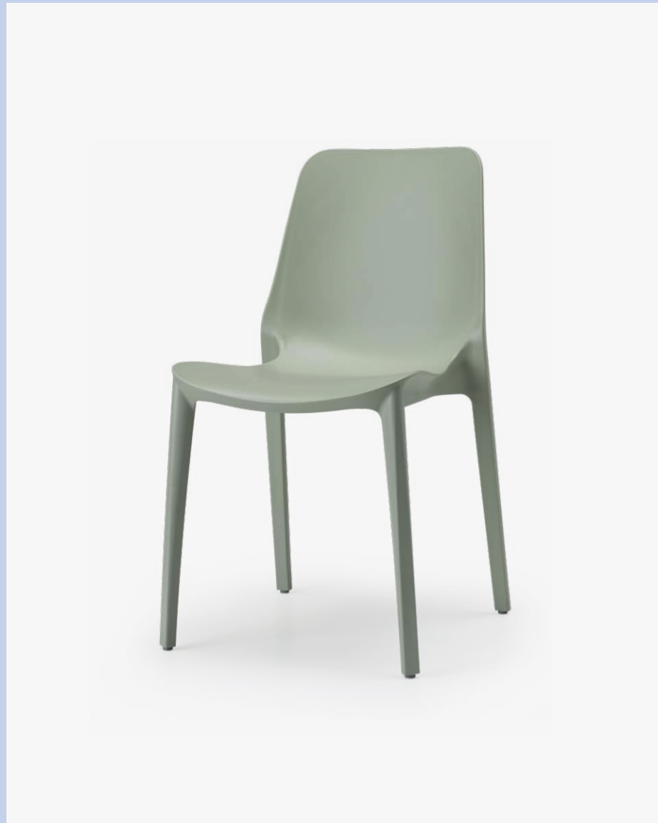
Stackable chair Sedia impilabile Ginevra, art. 2334

Also available in Go Green version. Disponibile anche in versione Go Green.