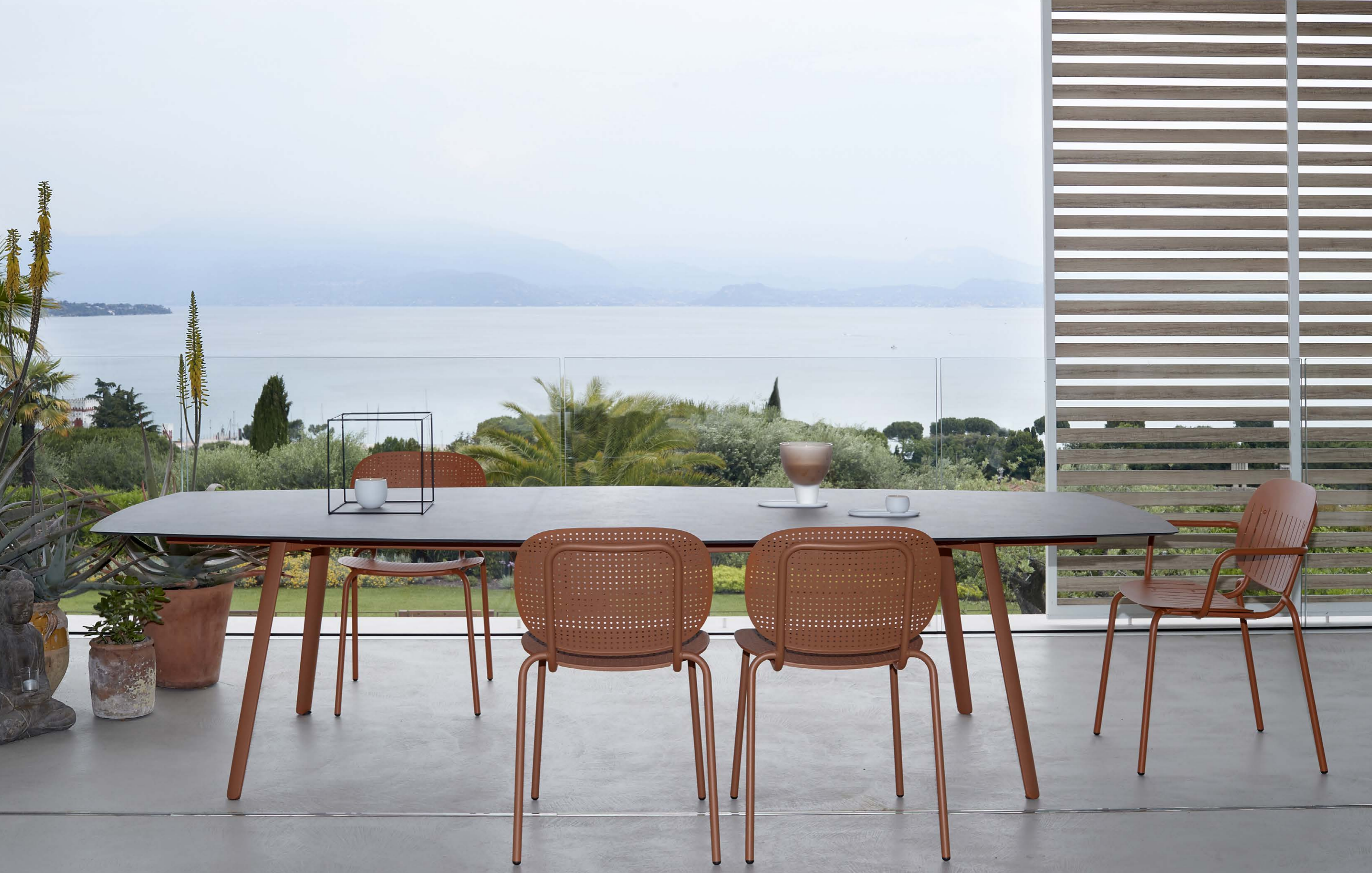
Hexagonal Table Tavolo Squid esagonale - 300x130, art.2437 Armchair Poltrona Si-Si Barcode, art. 2507 Chair Sedia Si-Si Dots, art. 2505