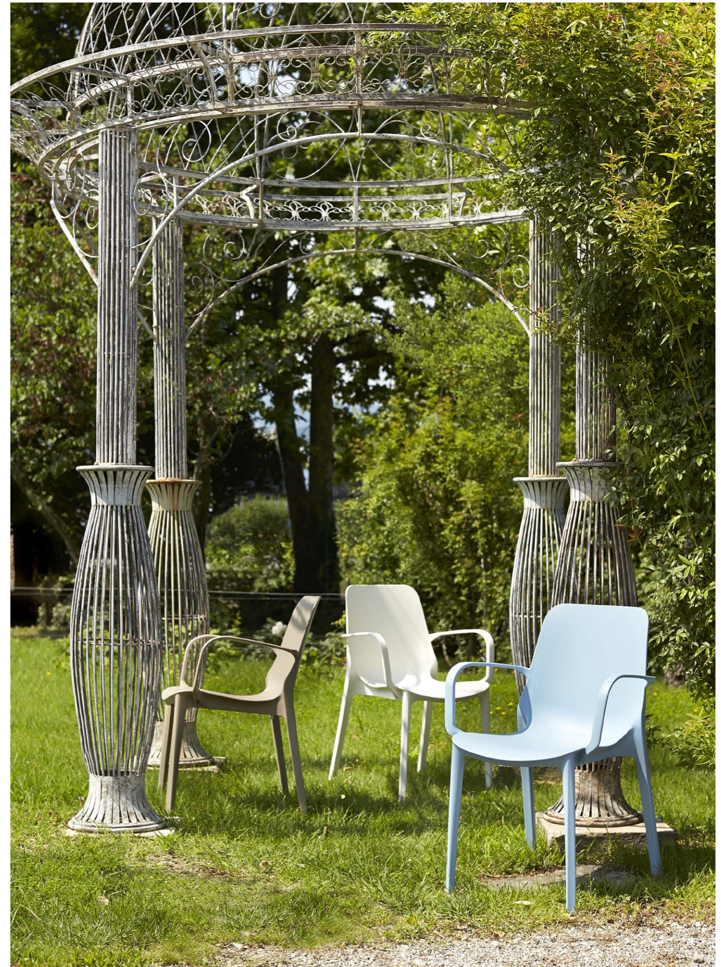
Stackable armchair Poltrona impilabile Ginevra, art. 2333

Also available in Go Green version. Disponibile anche in versione Go Green.