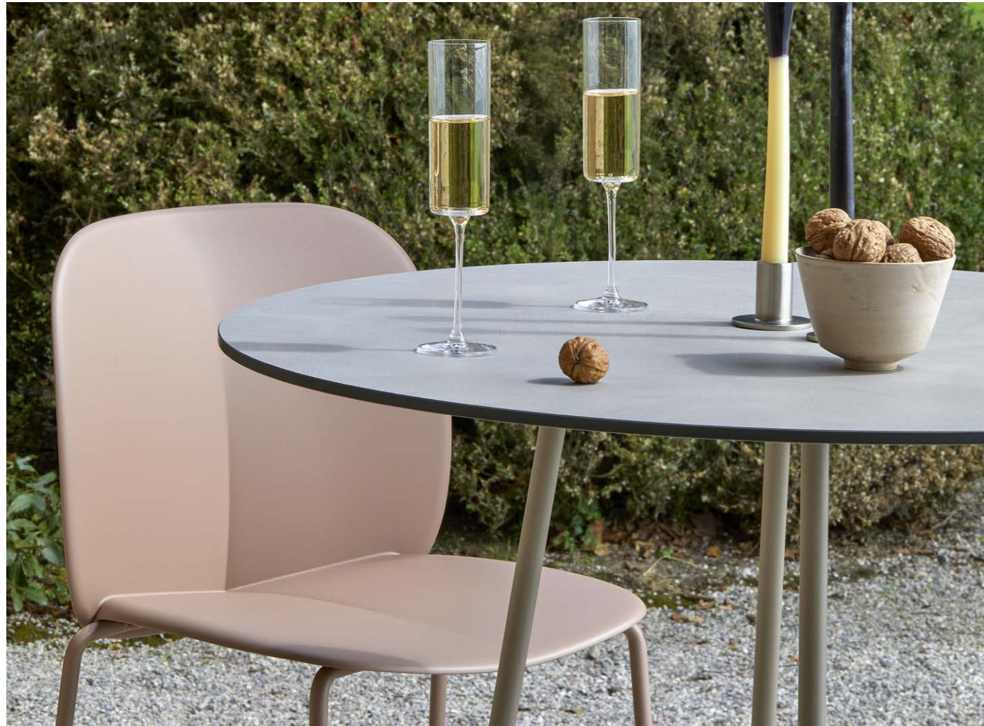
Barstool Sgabello Mentha, art. 2715 h.75 4 Legs Base Atomo, art. 5035 h.109