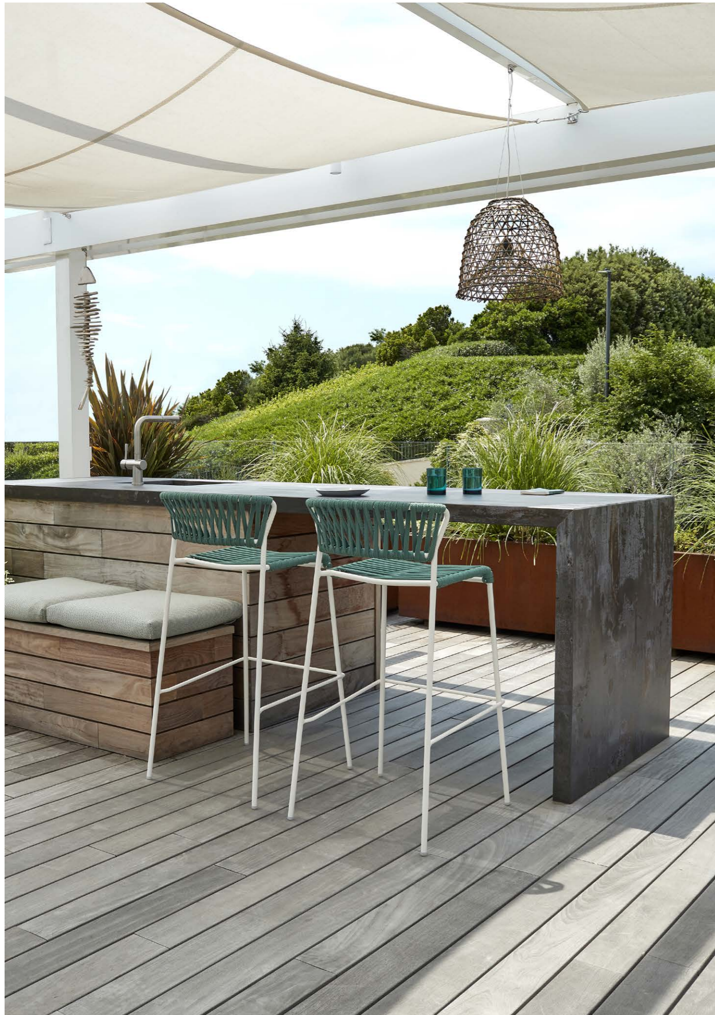
Barstool Sgabello Lisa Filò, art. 2871 h.75