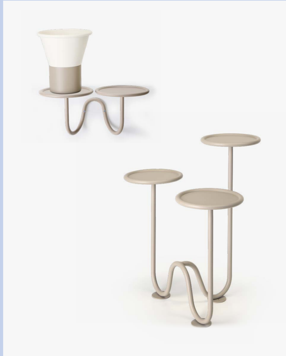
Plant holder wall mounted Porta piante da parete Mimosa, art. 2955 Plant holder floor Porta piante da terra Mimosa, art. 2956

(En) The Mimosa family of accessories is designed to showcase vegetation within our living spaces. As if suspended in levitation, these rounded supports welcome floral compositions or ornamental plants, while the sinuous tube connecting the trays evokes the idea of a root or rhizome with a line. Lively and colourful, these plant holders can be placed in a corner, against a wall, or wall-mounted, infusing softness and a sense of coziness into any environment. (It) La famiglia di accessori Mimosa è studiata per mettere in scena la vegetazione all'interno dei nostri spazi di vita. Come sospesi in levitazione, questi supporti arrotondati accolgono composizioni floreali o piante ornamentali, mentre il tubolare sinuoso che collega i vassoi evoca con una linea l'idea di radice o rizoma. Grafici e colorati, questi porta pianta possono essere inseriti in un angolo, contro un muro o come applique, infondendo morbidezza e senso di accoglienza ad ogni ambiente.