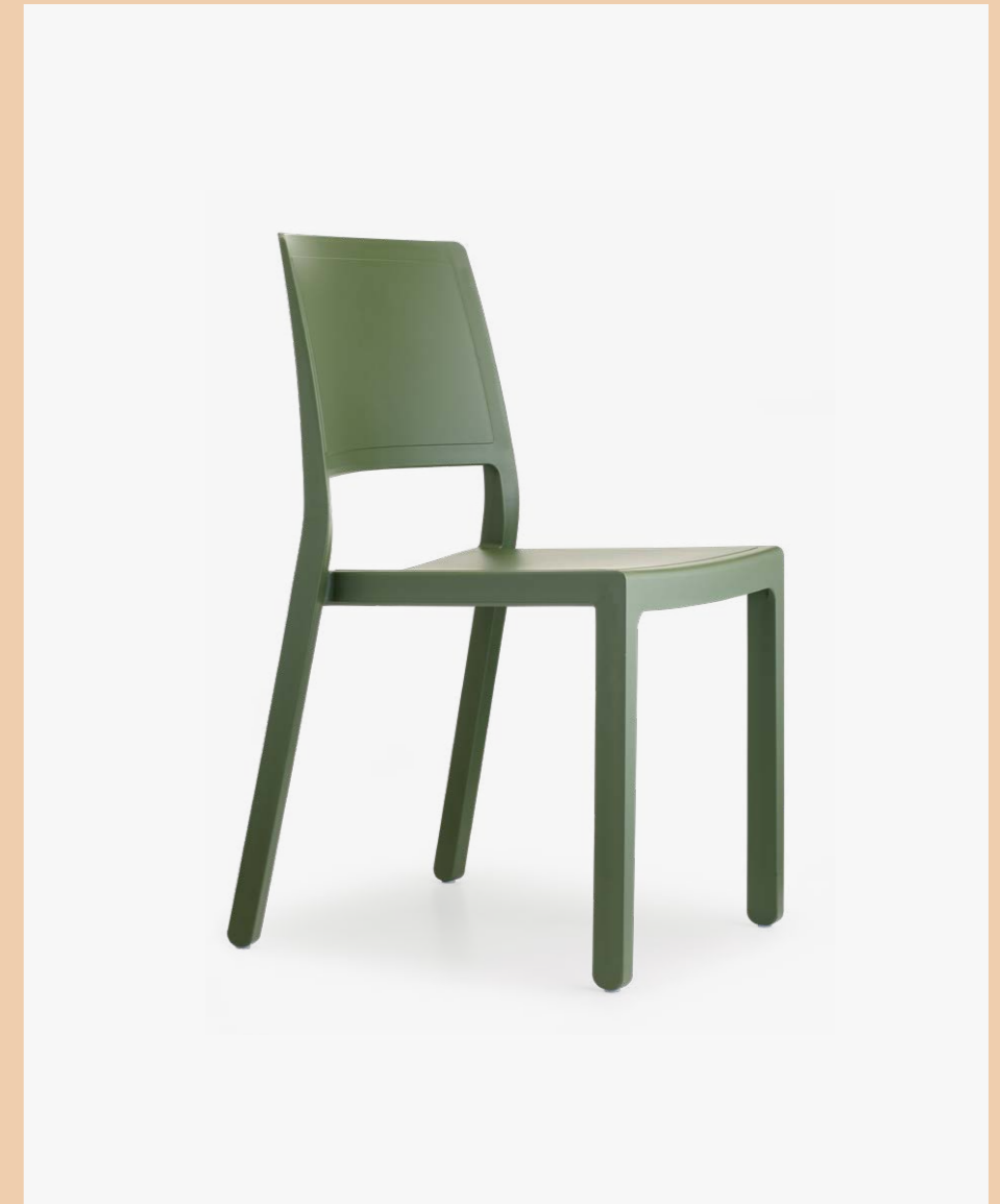
Stackable chair Sedia impilabile Kate, art. 2341