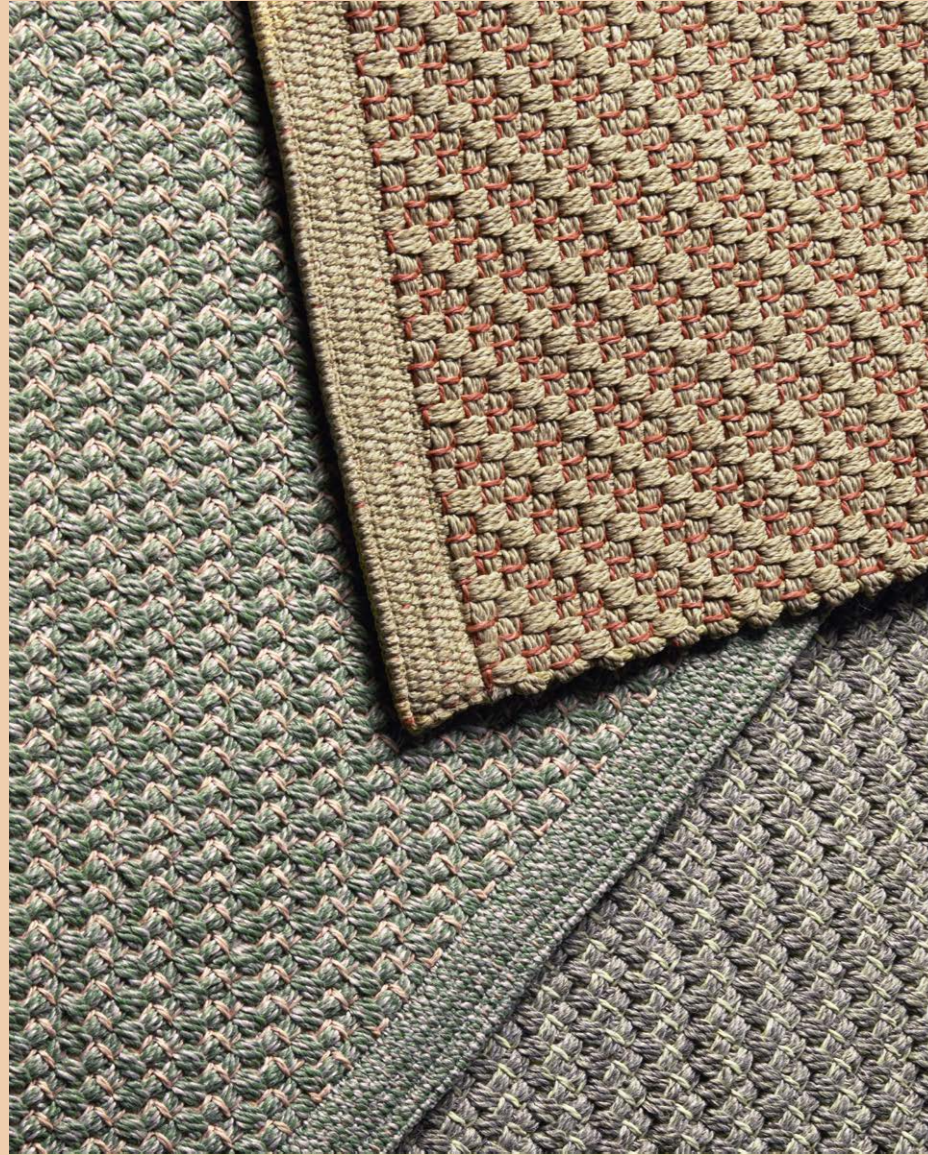
Outdoor rug Tappeto outdoor Marisco, art. 1593, 300x200 cm Outdoor rug Tappeto outdoor Marisco, art. 1594, 300x400 cm

(En) The Marisco rug reinterprets the ancient Sardinian tradition of cane coverings. The base weave is enriched with a coloured polypropylene thread that moves with its own rhythm. The handloom weaving lends it the thickness and elegance of an indoor rug, while the properties of the synthetic yarn make it suitable for outdoor use, ensuring optimal resistance to weathering. (It) Il tappeto Marisco reinterpreta l'antica tradizione sarda delle coperture in canna. La trama di base si arricchisce della presenza di un filo colorato in polipropilene che si muove con un ritmo autonomo. La lavorazione su telaio manuale regala lo spessore e l'eleganza di un tappeto per interni, mentre le caratteristiche del filato sintetico si adattano all'utilizzo outdoor, garantendo una resistenza ottimale agli agenti atmosferici.