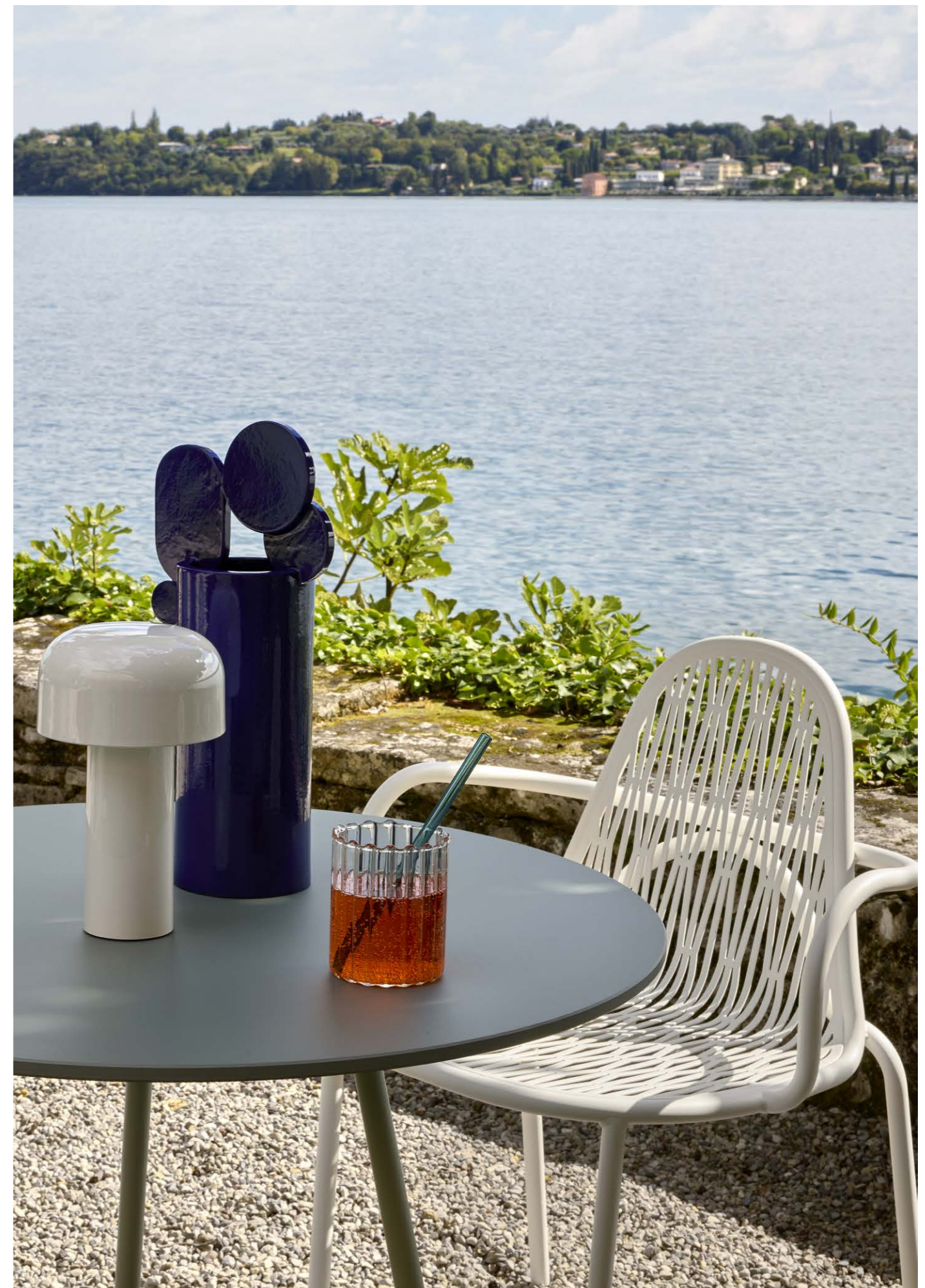
Armchair Poltrona Malvasia, art. 2907

(En) Malvasia is an outdoor seat that projects graceful and straight patterns of lights and shadows through its metal weaves. Evoking the warp and weft of a fabric, but also the play of shadows of a tree canopy, Malvasia is a seat that lends itself to animate any outdoor space, even terraces and gardens. (It) Malvasia è una seduta da esterni che proietta attraverso le sue trame metalliche garbati e rigorosi intrecci di luci e ombre. Evocando la trama e l'ordito di un tessuto, ma anche i giochi d'ombra della chioma di un albero, Malvasia è una seduta che si presta ad animare qualsiasi spazio esterno, sia questo un dehors, una terrazza o un giardino.