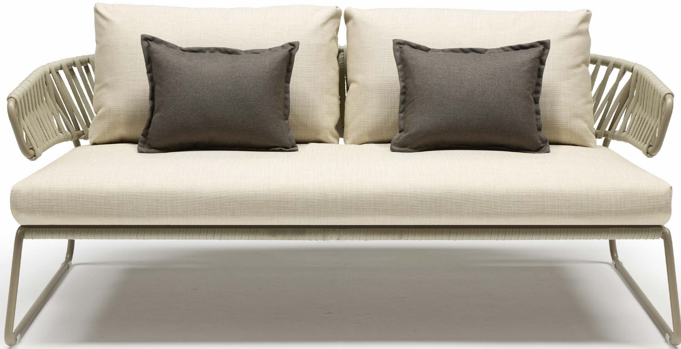
Lisa Sofa Filò, art. 2884