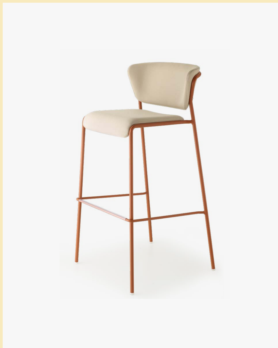
Barstool Sgabello Lisa Outdoor, art. 2862 h.75