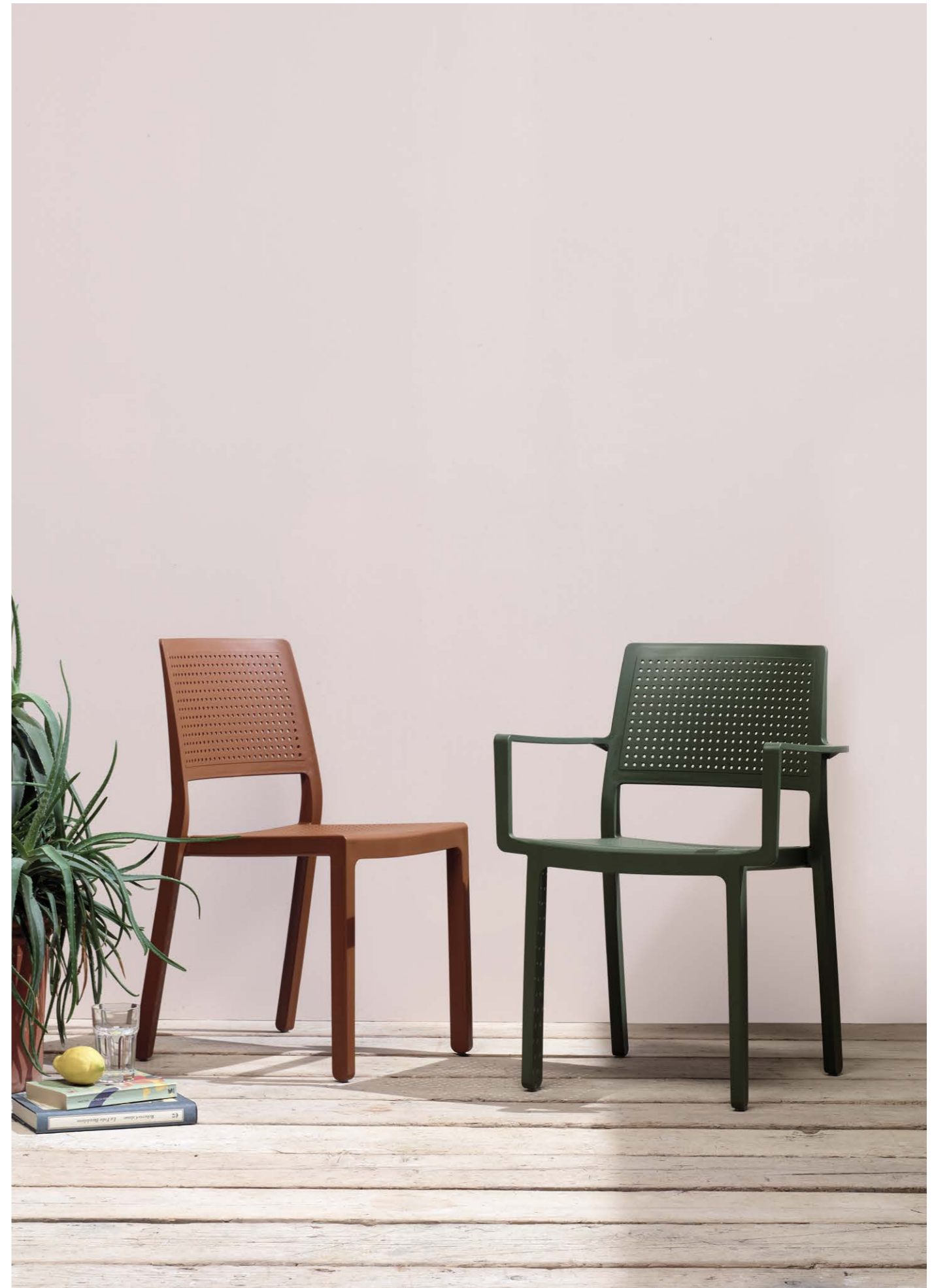
Stackable armchair Poltrona impilabile Emi, art. 2342 Stackable chair Sedia impilabile Emi, art. 2343