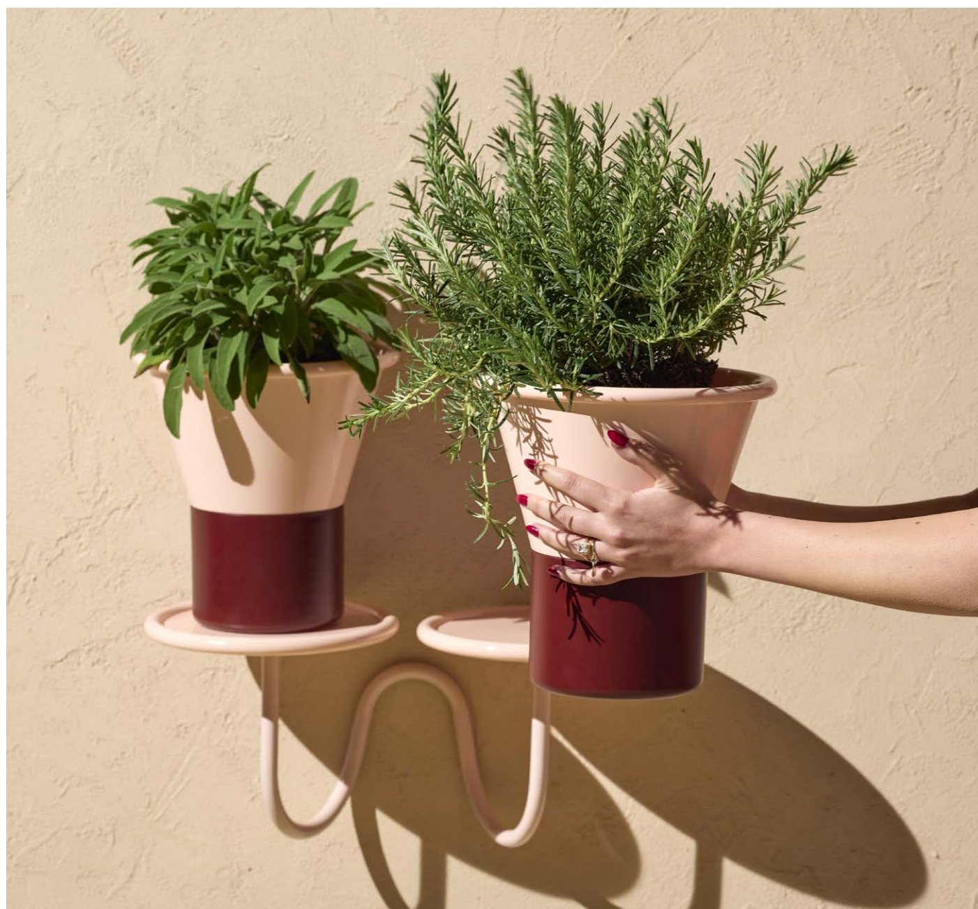
Vases Vasi Mimosa, art. 2957 h.25 Vases Vasi Mimosa, art. 2958 h.31 Plant holder wall mounted Porta piante da parete Mimosa, art. 2955

(En) With a strong graphic impact, this timeless duo of aluminium vases recalls both in silhouette and in the play of shades the morphology of a flower in its connection between peduncle and corolla. Suitable for accommodating diverse compositions, they enhance the presence of flowers, making them protagonists of our daily lives. (It) Dal forte impatto grafico, questo duo di vasi in alluminio rievoca tanto nella silhouette che nel gioco di sfumature la morfologia di un fiore nel suo innesto tra peduncolo e corolla. Adatti ad accogliere composizioni eterogenee, esaltano la presenza dei fiori, rendendoli protagonisti del nostro quotidiano.