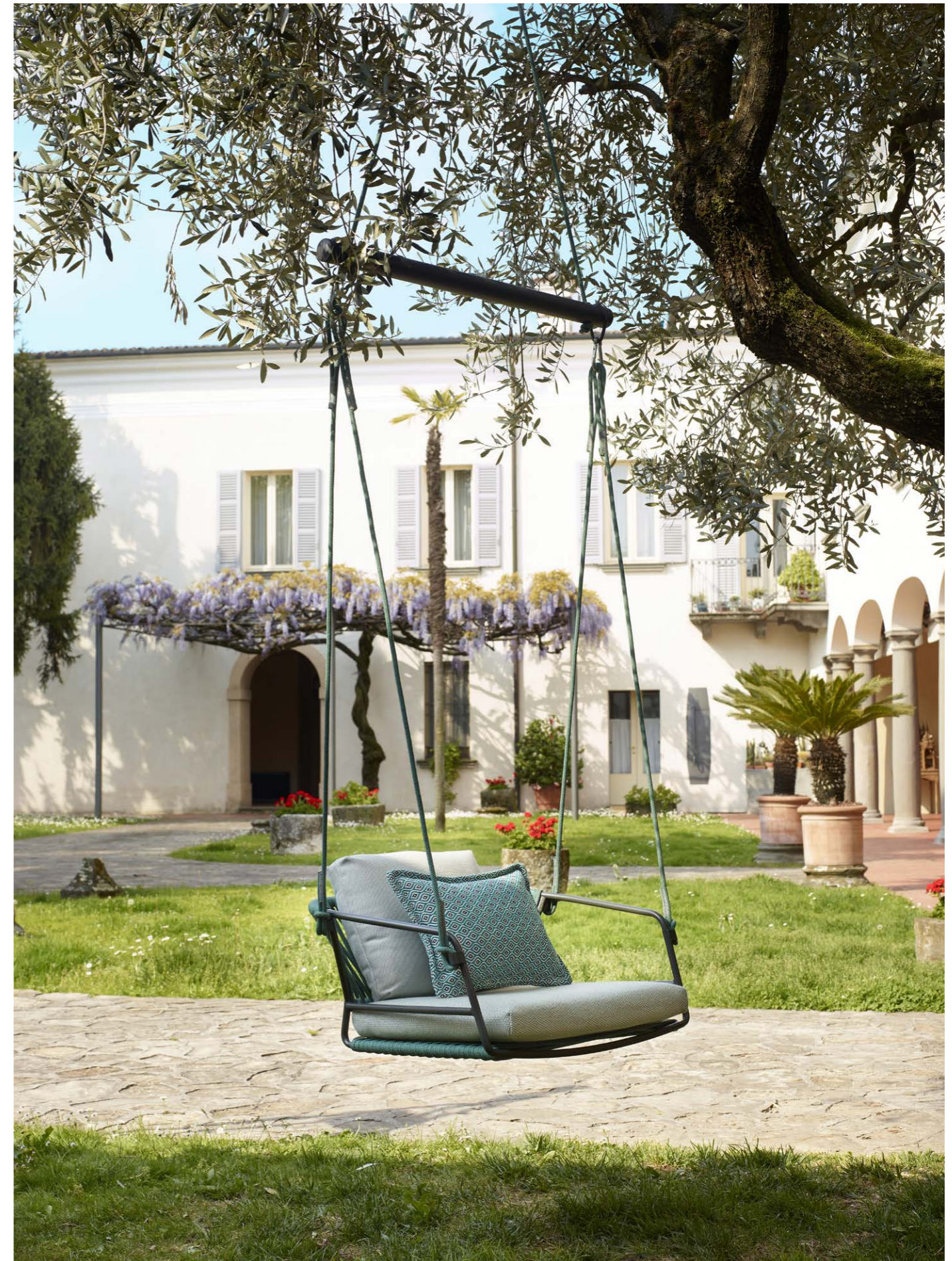
Hanging armchair Seduta Sospesa Lisa Swing, art. 2883

Telaio in acciaio zincato e verniciato a polvere, intreccio in corda nautica. Optional: cuscini tessuto Sunbrella®.