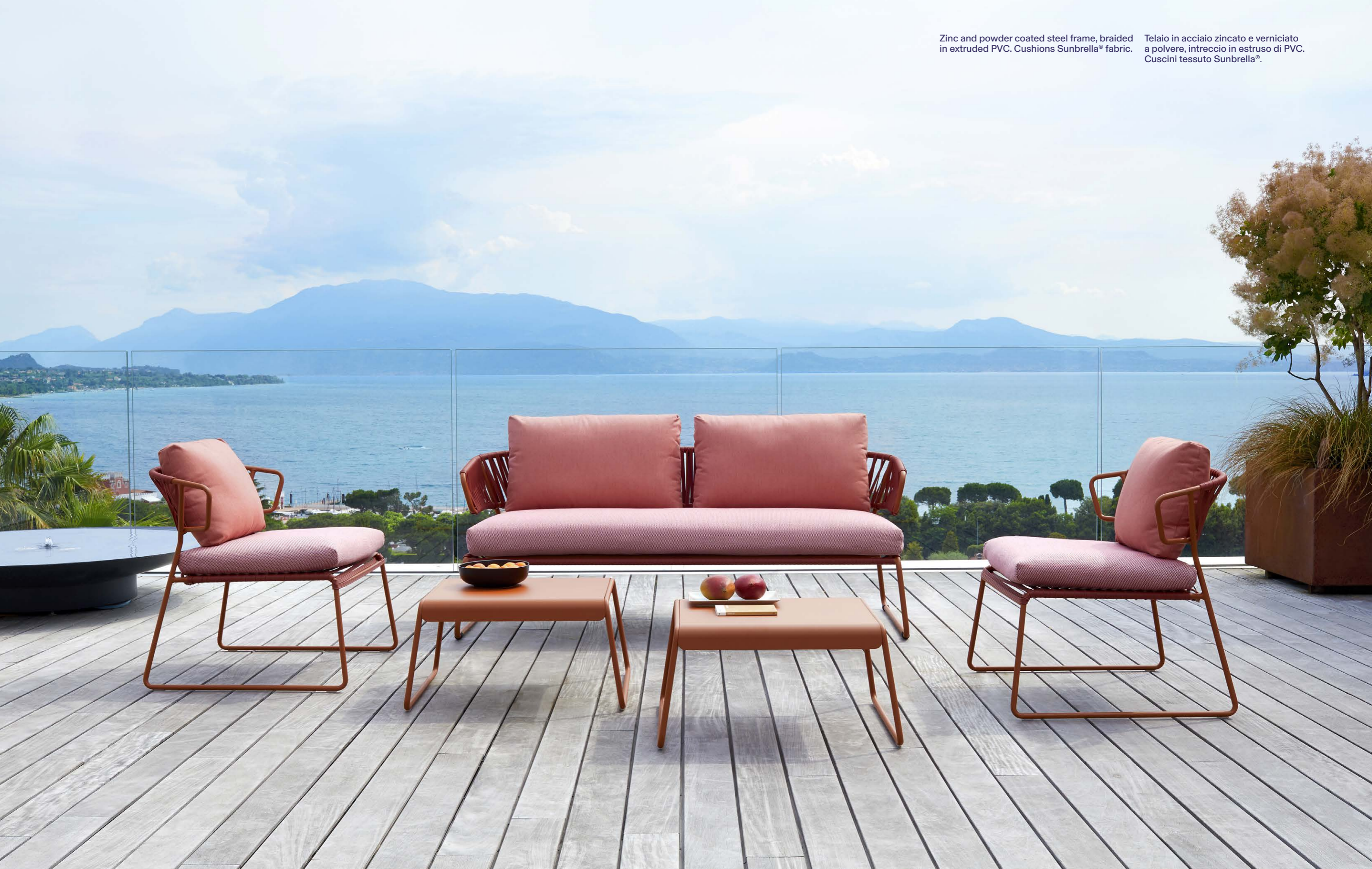
Lisa Sofa Club, art. 2885 Armchair Poltrona Lisa Lounge Club, art. 2877 Side Table Lisa Lounge, art. 2879

Telaio in acciaio zincato e verniciato a polvere, intreccio in estruso di PVC. Cuscini tessuto Sunbrella®.