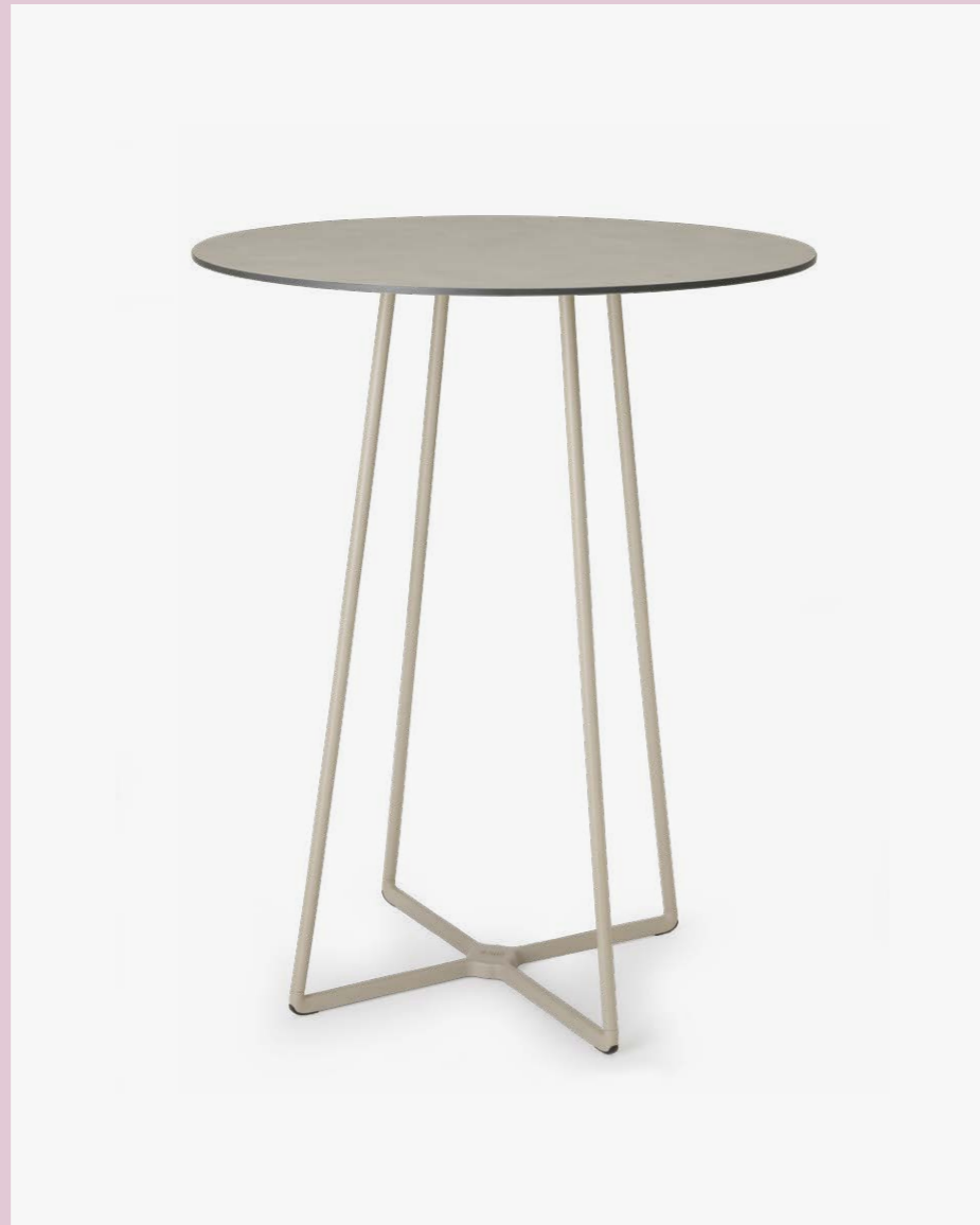
4 Legs Base Atomo, art. 5035 h.109

(En) The Atomo project stems from the need to create a table capable of fitting into any environment and becoming its focal point. Lightweight and sturdy, the metal structure consists of a die-cast aluminium ground base onto which the steel legs are attached.