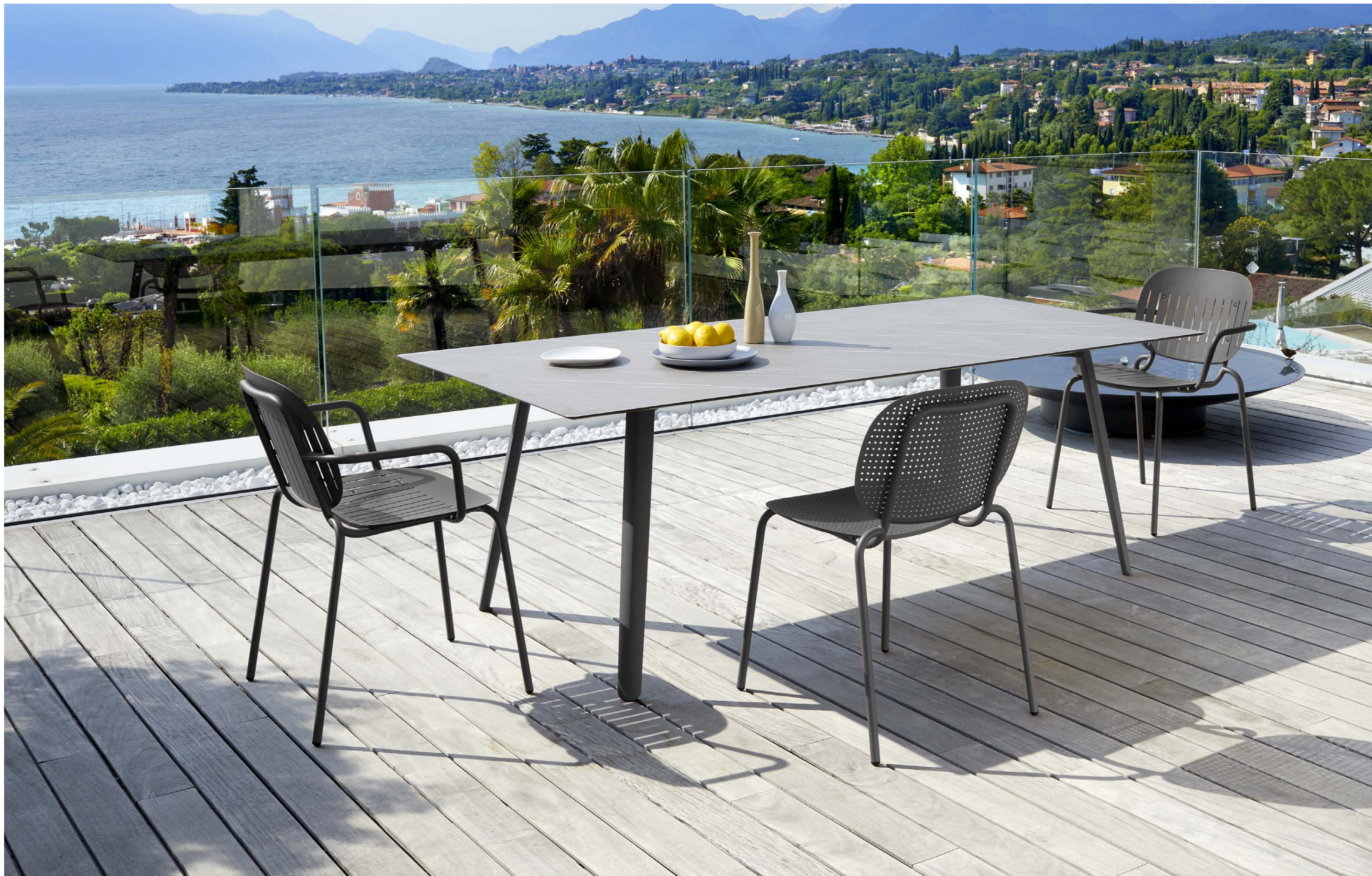
Rectangular Table Tavolo Squid rettangolare - 210x100, art. 2431 Piasentina stone effect top / Piano effetto pietra piasentina Armchair Poltrona Si-Si Barcode, art. 2507 Chair Sedia Si-Si Dots, art. 2505