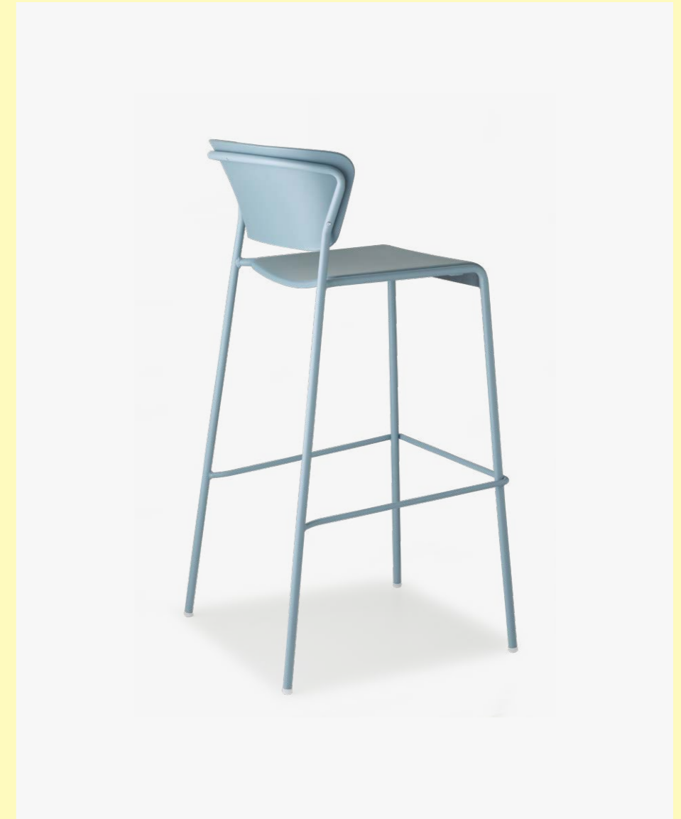
Barstool Sgabello Lisa Tecnopolimero, art. 2867 h.75