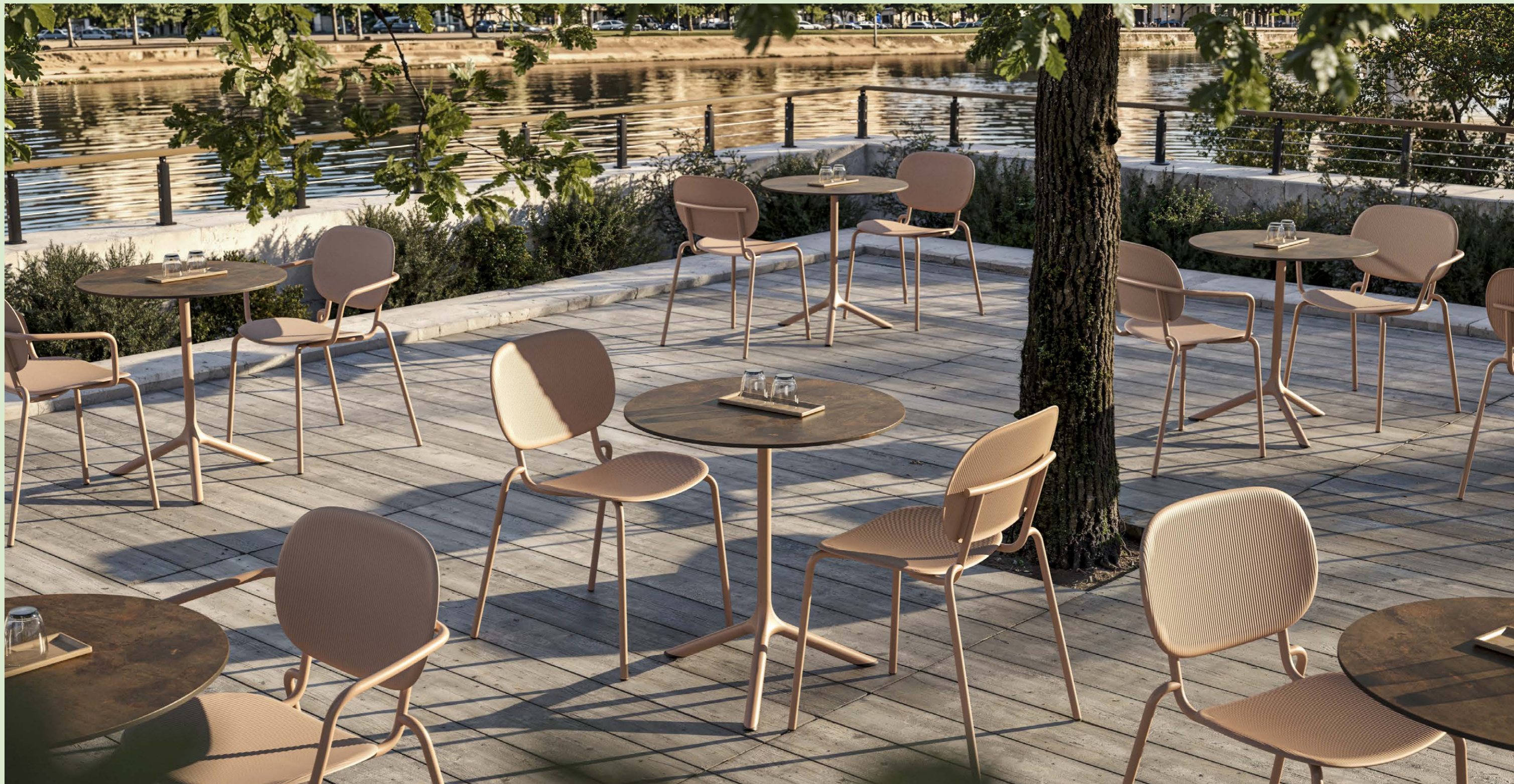
Chair Sedia Si-Si Vibes, art. 2512 Armchair Poltrona Si-Si Vibes, art. 2513 Base Tripé, art. 5002 h. 73

(En) Eclectic seating, Si-Si interprets the delicate balance between indoor and outdoor. A single shell, fixed to the slender frame, serves equally as the backrest and seat. A frame and various "shells" with heterogeneous textures and materials allow it to be used in very different environments. Si-Si Vibes is made of certified regenerated plastic with a unique pattern that enhances the seat and backrest. (It) Seduta eclettica, Si-Si interpreta il labile equilibrio tra indoor e outdoor. Un'unica scocca, fissata allo snello telaio, funge indifferentemente da schienale e da seduta. Un telaio e diverse "scocche", con texture e materiali eterogenei, ne consentono la fruizione in ambienti molto differenti. Si-Si Vibes, dall'inedito pattern che arricchisce seduta e schienale, è realizzata in plastica rigenerata certificata.