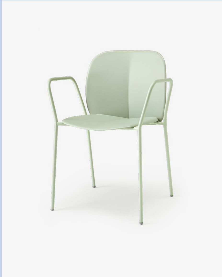
Armchair Poltrona Mentha, art. 2707

(En) Mentha is a cool, comfortable and cosy seat, made from certified recycled plastic. Mentha is a seating system, the shell can be paired with a variety of frames, making it a highly versatile collection. (It) Mentha è una seduta fresca, pratica, confortevole e accogliente in plastica certificata riciclata. Mentha rappresenta un sistema di sedute, la scocca viene montata su diverse tipologie di telaio: per questo è una collezione altamente versatile.