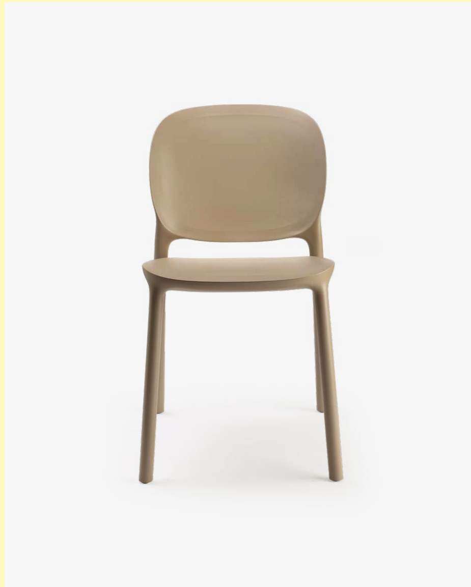
Chair Sedia Hug, art. 2380

(En) The HUG chair collection is made entirely from second-life materials. There are two variants: an all-technopolymer version, perfect for outdoor environments, and a softer one with the addition of a seat cushion and padded band covered in fabric, even more enveloping. (It) La collezione di sedute HUG è realizzata al 100% con materiali al secondo ciclo di vita. Due sono le varianti: una versione tutta in tecnopolimero, perfetta per l'outdoor, un'altra più aggraziata con l'aggiunta di cuscino di seduta e fascia imbottita e rivestita in tessuto, ancora più avvolgente.