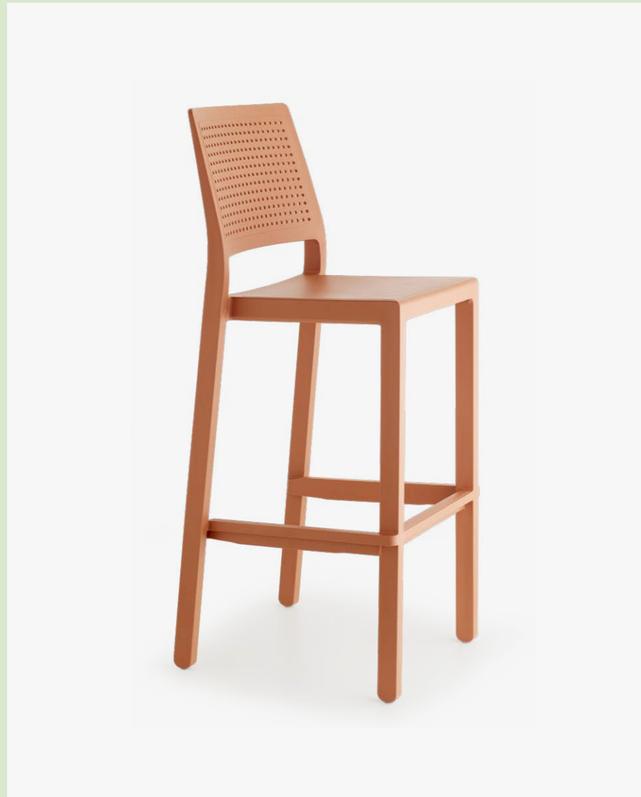
Stackable barstool Sgabello impilabile Emi, art. 2345 h.75