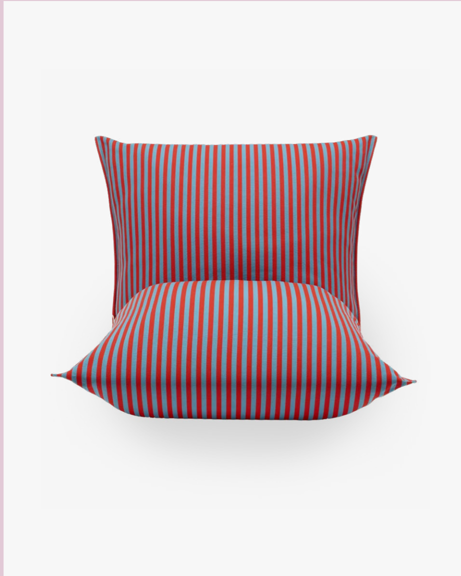
Armchair Poltrona Brezza Relax, art. 2911

(En) Brezza Relax, a generous lounge chair that sits gently on the floor, invites you to sit back and enjoy a moment of socialising or rest. Designed for outdoor spaces, it draws inspiration from the archetypal shape of two large cushions placed side by side, forming a seat with a generously rounded backrest. (It) Brezza Relax, una generosa lounge chair, si adagia placidamente a terra ed invita ad accomodarsi per un momento di convivialità o di riposo. Pensata per gli spazi outdoor, trae ispirazione dalla forma archetipica di due grandi cuscini che, accostati, creano una seduta con schienale dalla morfologia generosa e paffuta.