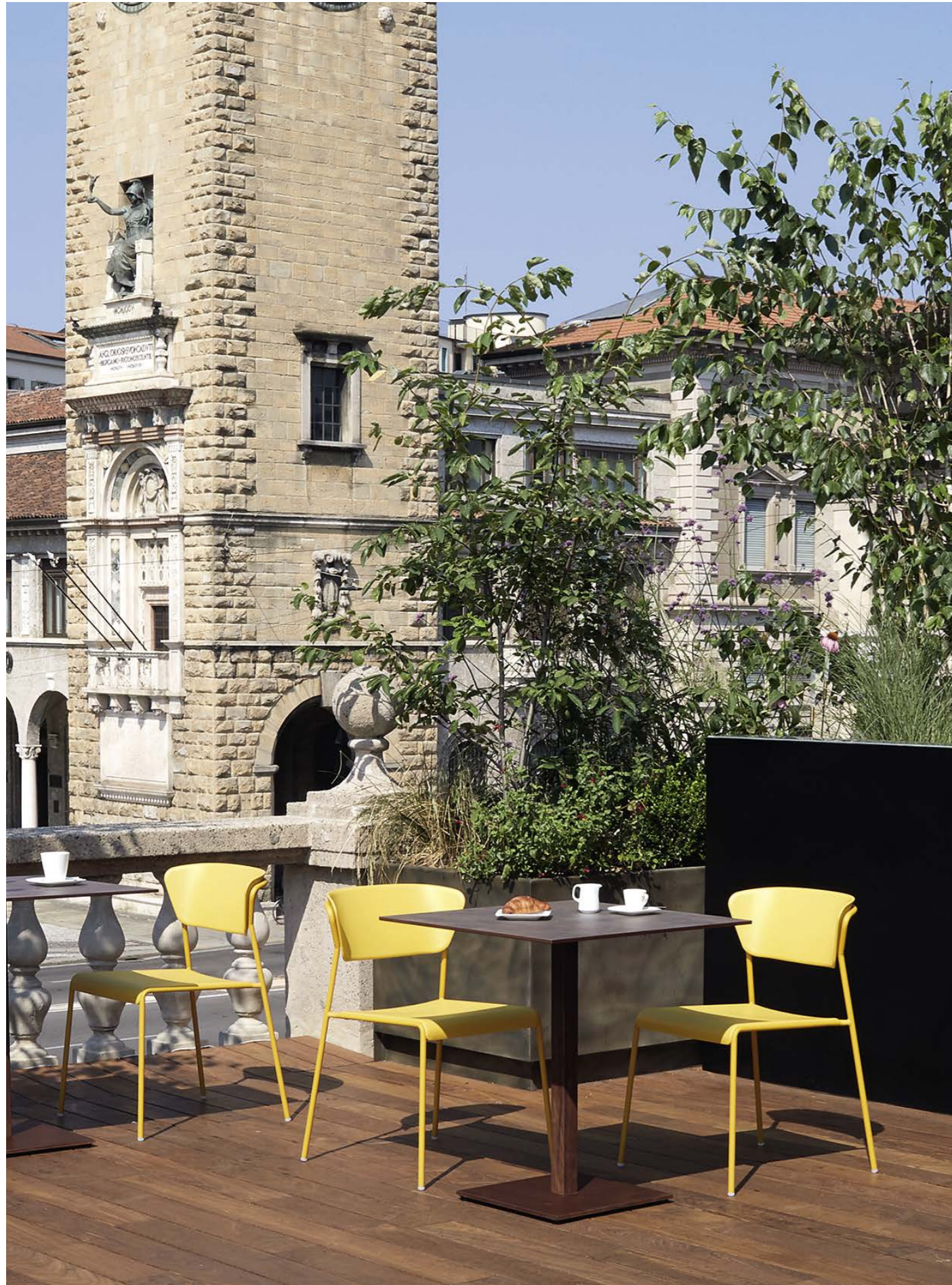
Chair Sedia Lisa Tecnopolimero, art. 2865 Base Tiffany, art. 5182

Also available in Go Green version. Disponibile anche in versione Go Green.