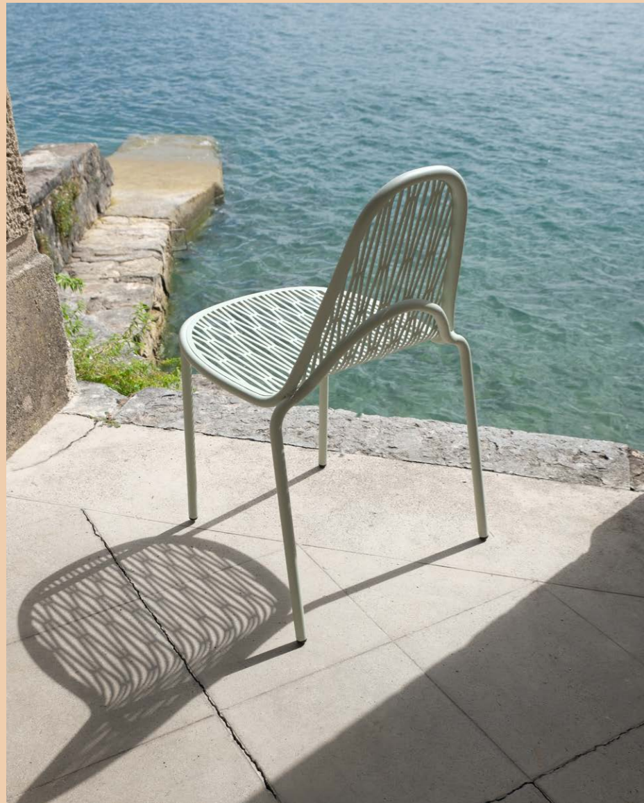
Chair Sedia Malvasia, art. 2906

(En) Malvasia is an outdoor seat that projects graceful and straight patterns of lights and shadows through its metal weaves. Evoking the warp and weft of a fabric, but also the play of shadows of a tree canopy, Malvasia is a seat that lends itself to animate any outdoor space, even terraces and gardens. (It) Malvasia è una seduta da esterni che proietta attraverso le sue trame metalliche garbati e rigorosi intrecci di luci e ombre. Evocando la trama e l'ordito di un tessuto, ma anche i giochi d'ombra della chioma di un albero, Malvasia è una seduta che si presta ad animare qualsiasi spazio esterno, sia questo un dehors, una terrazza o un giardino.