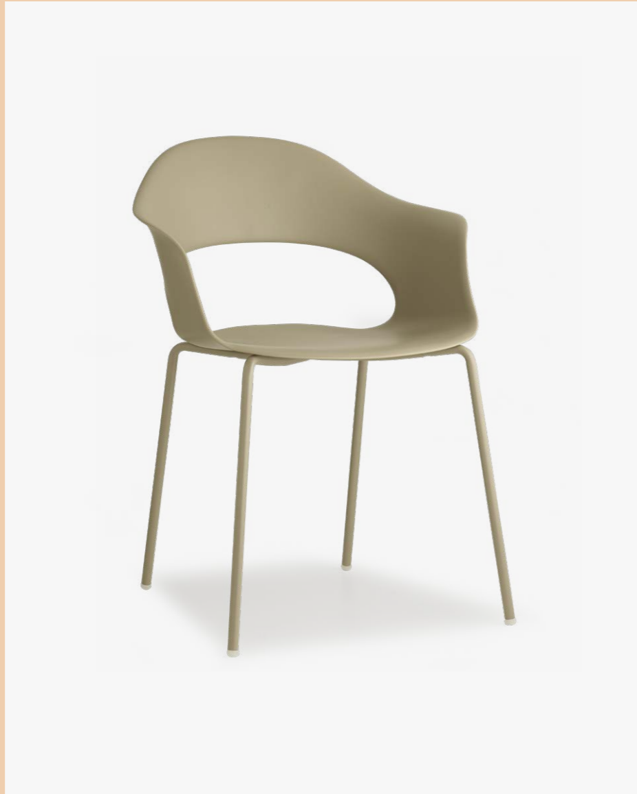
Armchair Poltrona Lady B, art. 2696